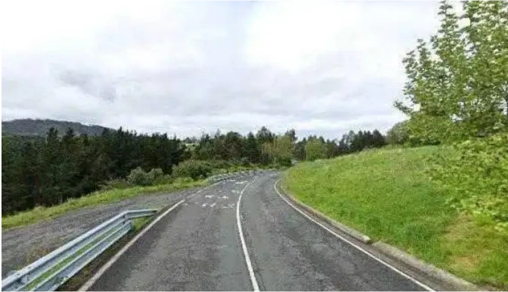
Ermita de santa agueda natxitua videos