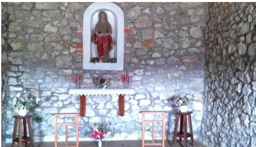
Ermita de santa agueda natxitua iglesia