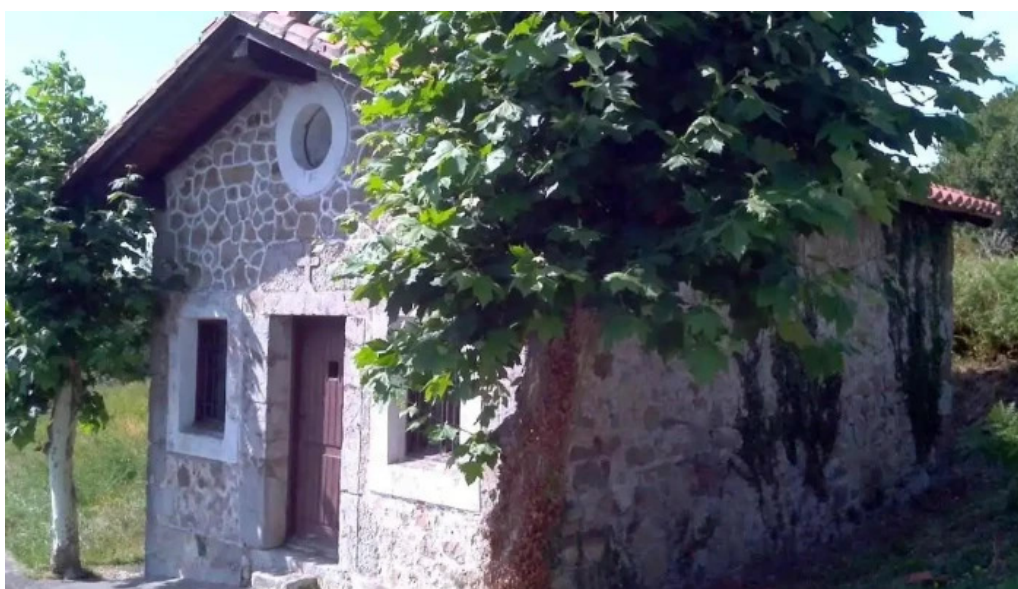
Ermita de santa agueda natxitua ibarranguelua