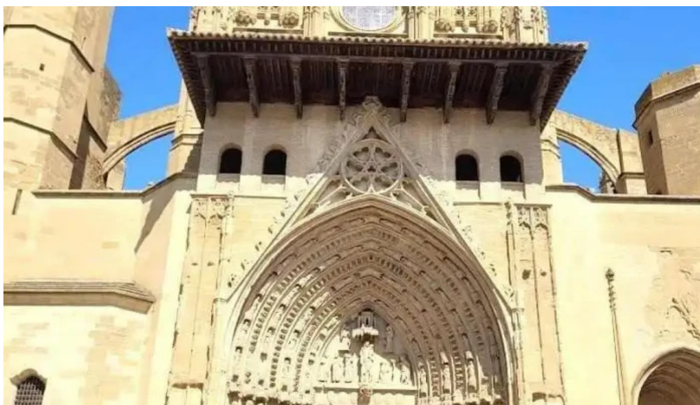
Torre campanario de la catedral huesca