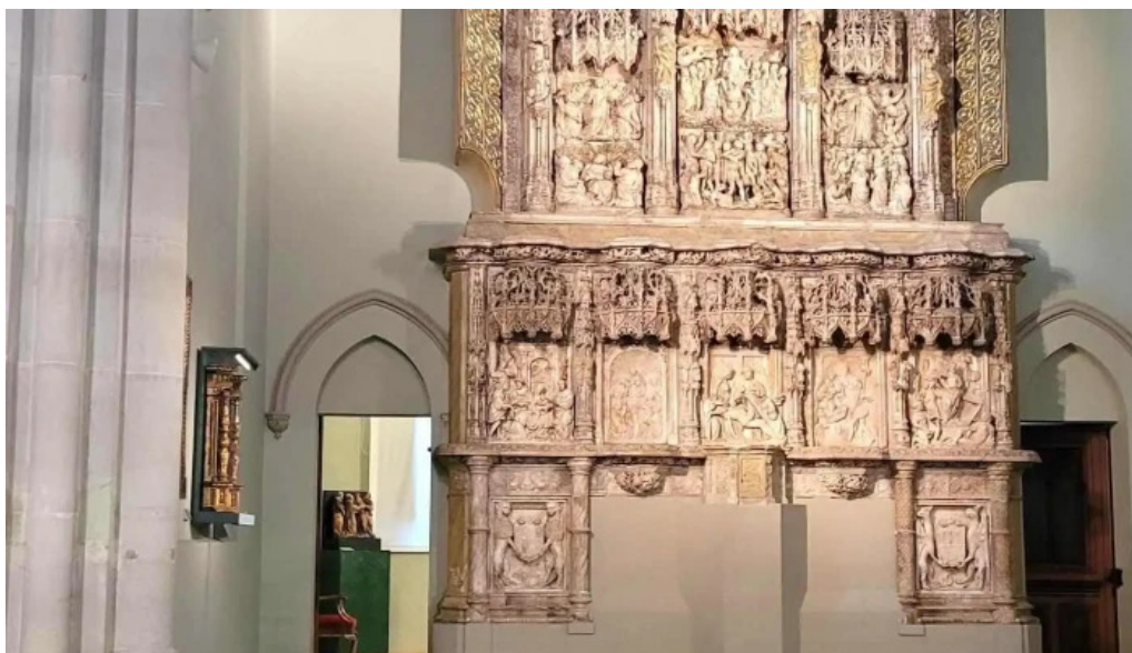
Torre campanario de la catedral iglesia