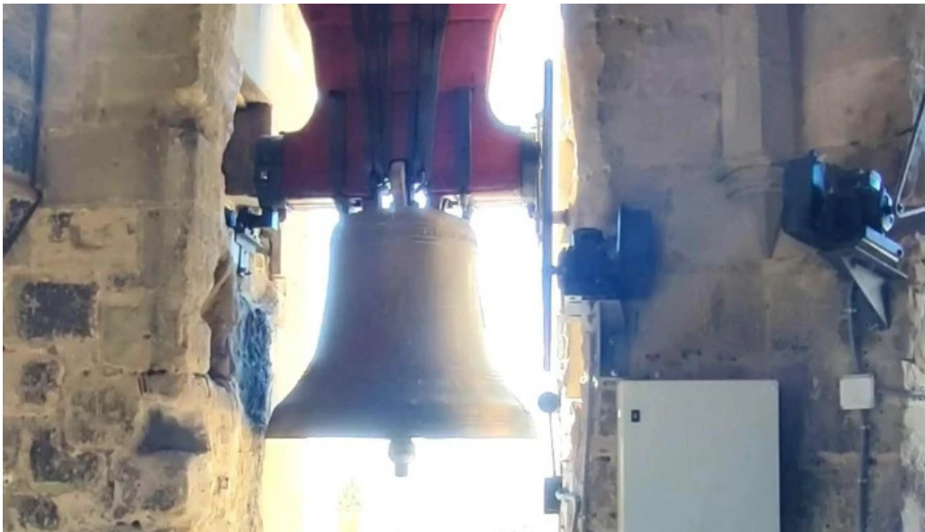
Torre campanario de la catedral comentario 1