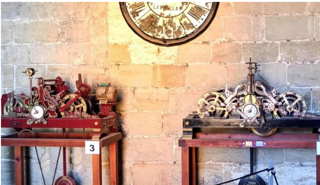
Torre campanario de la catedral comentario 3