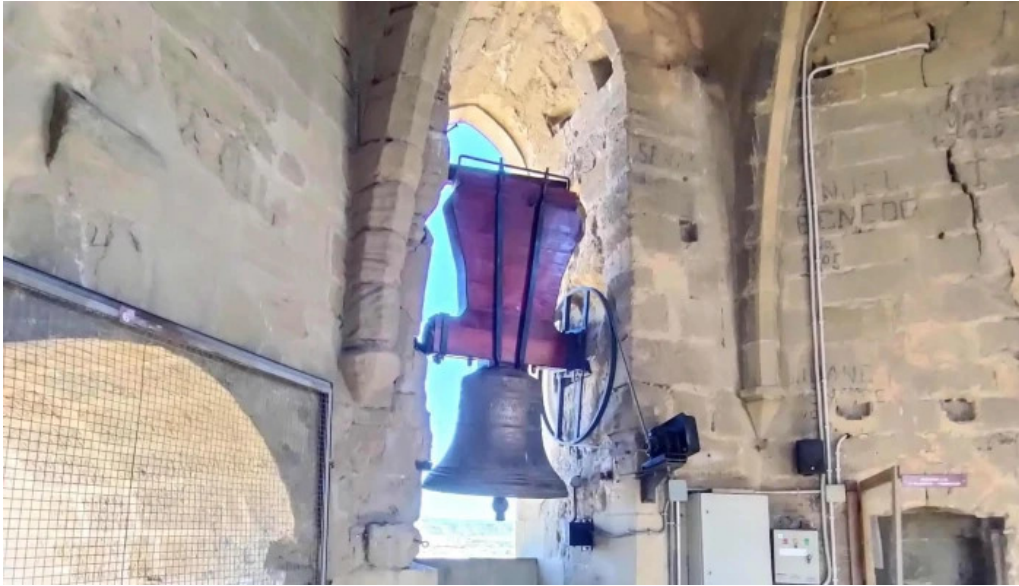
Torre campanario de la catedral comentario 2