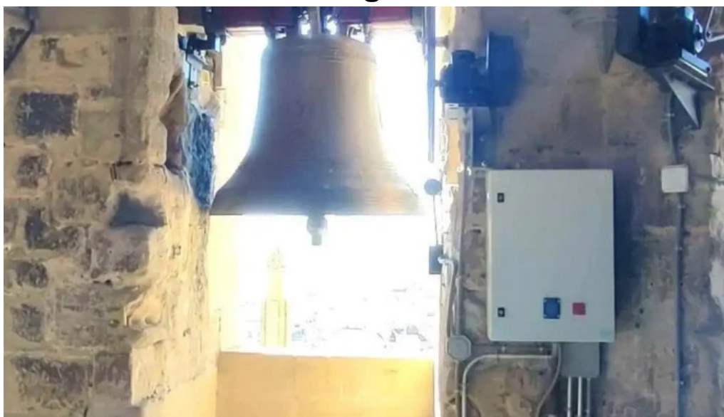
Torre campanario de la catedral videos