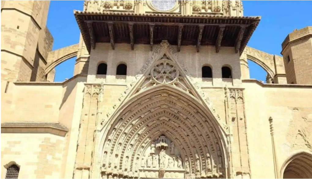
Torre campanario de la catedral campanario