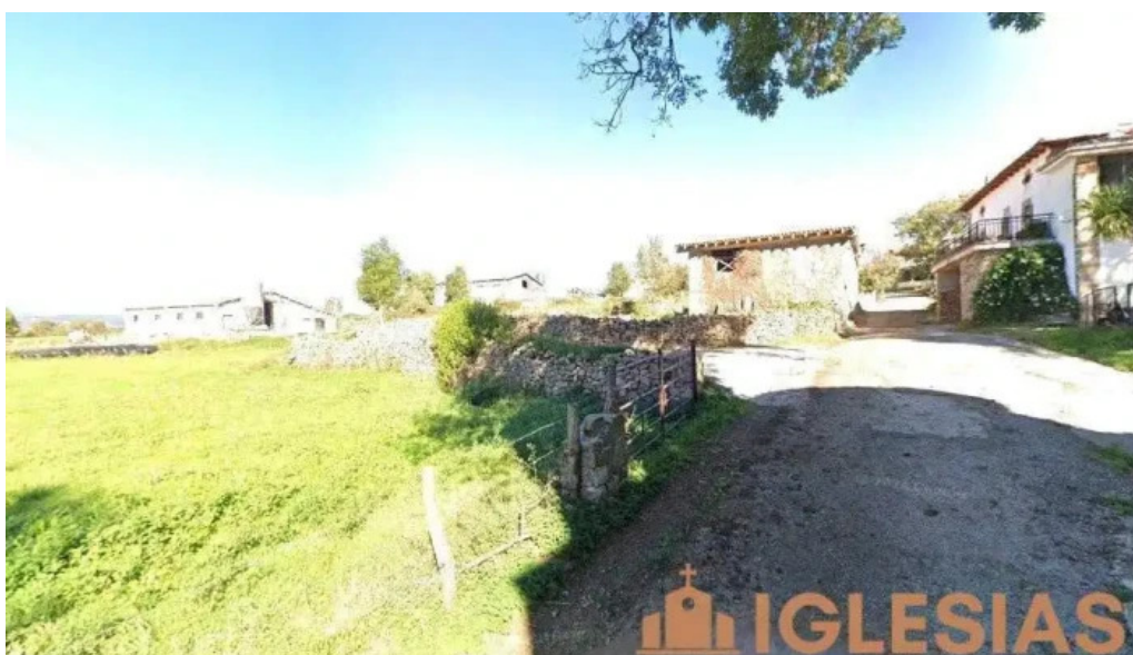
Parroquia san martin herada