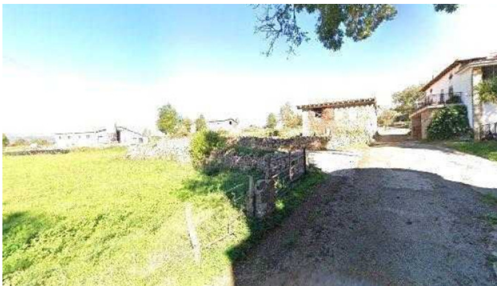
Parroquia san martin iglesia