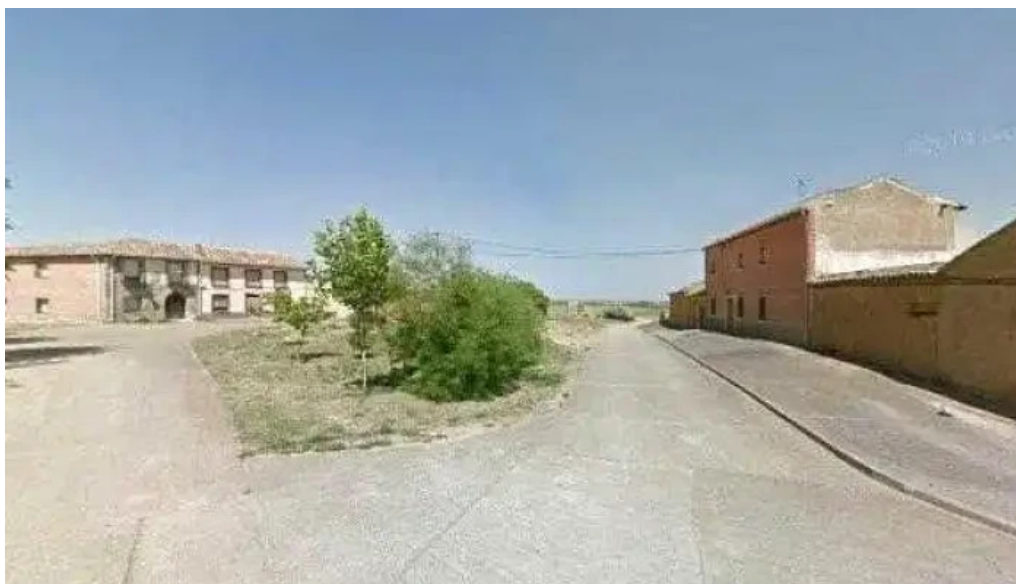
Iglesia nuestra senora de la antigua descuentos