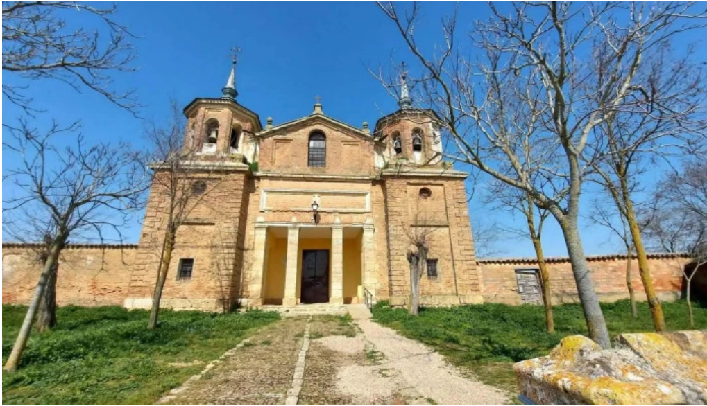
Iglesia nuestra senora de la antigua iglesia