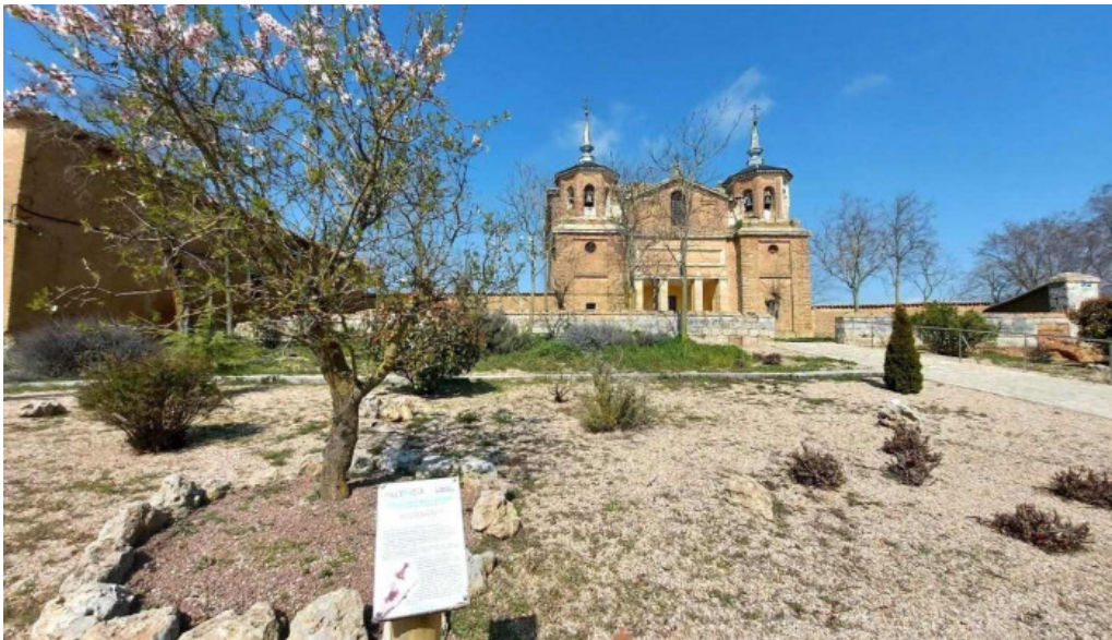
Iglesia nuestra senora de la antigua guaza de campos