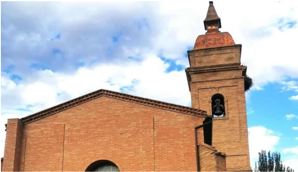
Iglesia de san martin de tours promocion