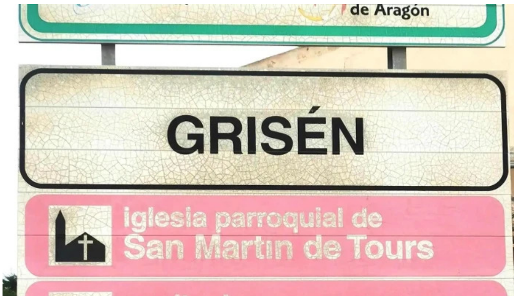
Iglesia de san martin de tours grisen