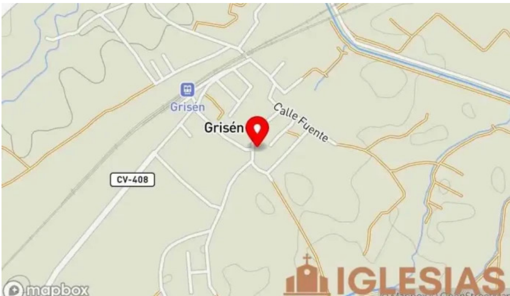
Iglesia de san martin de tours mapa