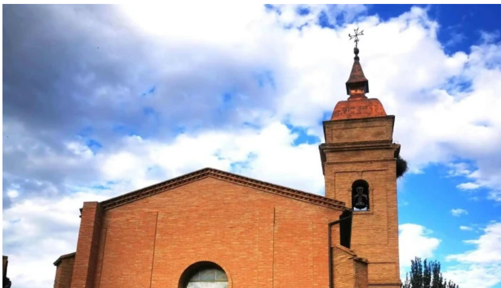
Iglesia de san martin de tours descuentos