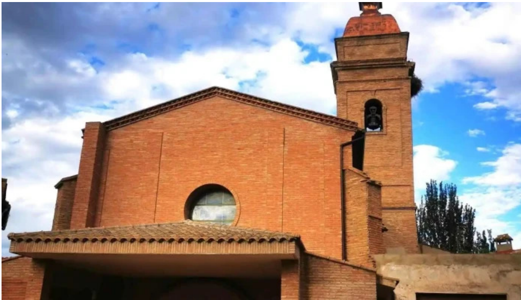
Iglesia de san martin de tours iglesia