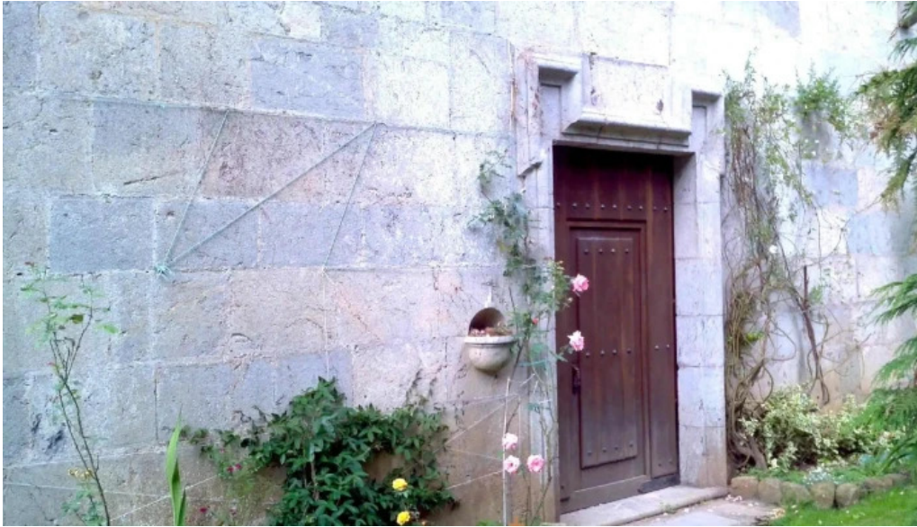
Ernita de nuestra senora de oibar iglesia