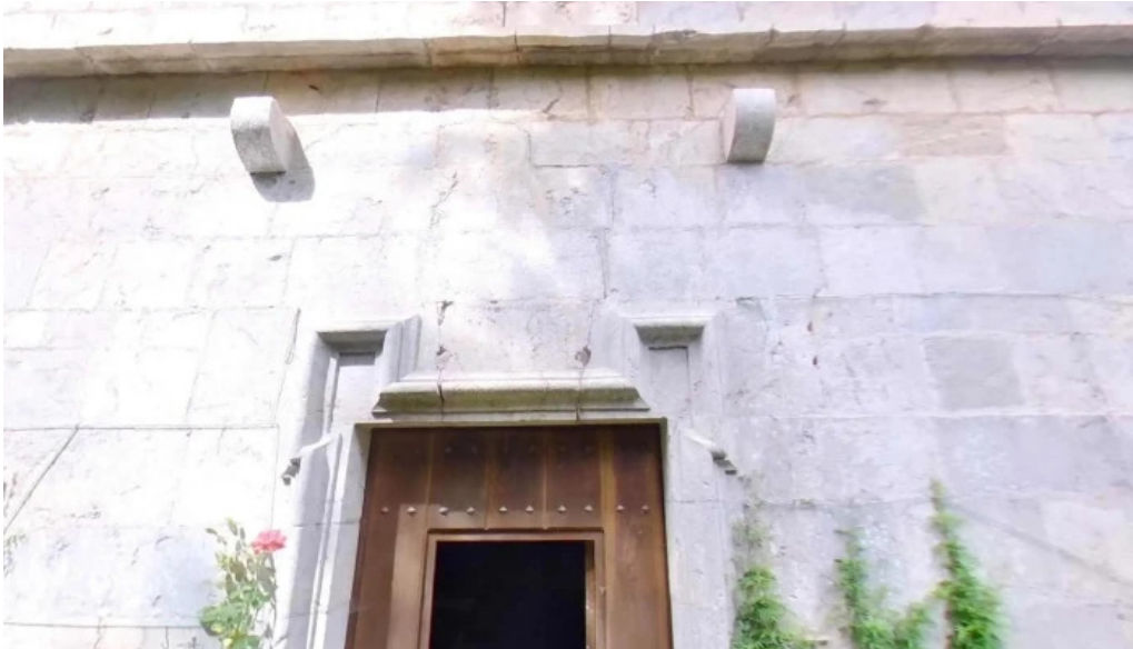
Ermita de nuestra senora de oibar puntaje