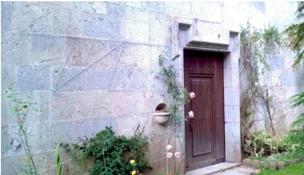
Ernita de nuestra senora de oibar gizaburuaga