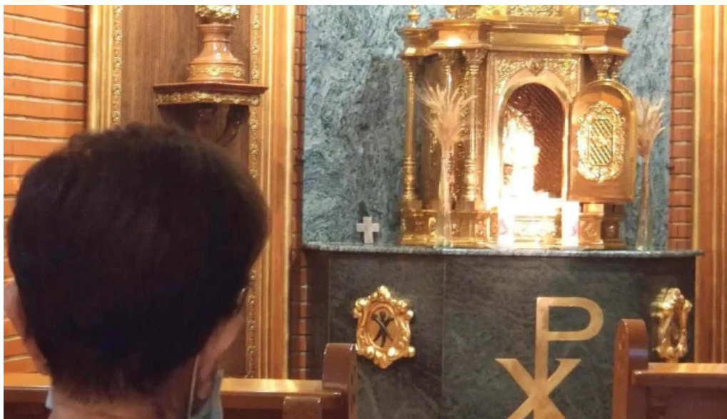
Parroquia sant joan bautista i sant antoni abad iglesia