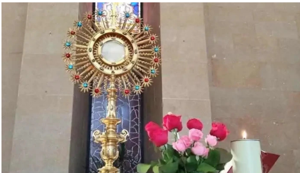
Parroquia sant joan bautista i sant antoni abad gavarda