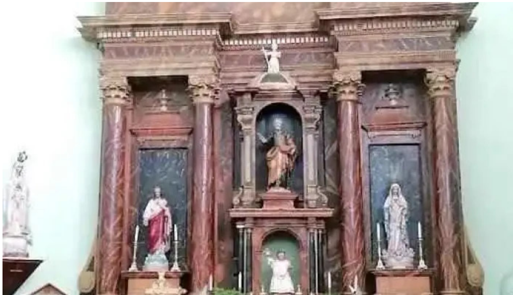
Iglesia de san pedro apostol fuentesoto