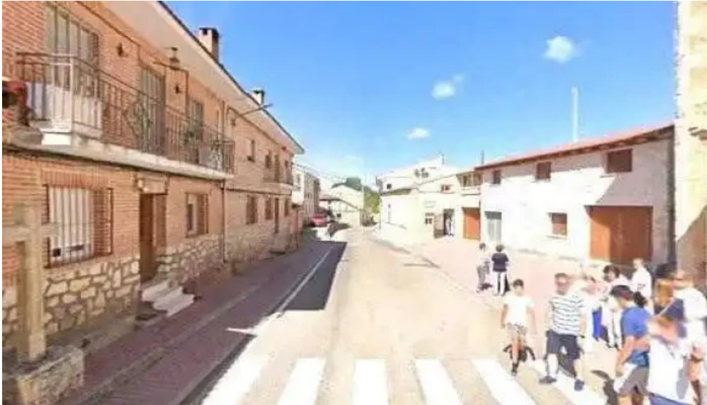
Iglesia de san pedro apostol fotos