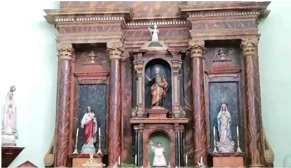
Iglesia de san pedro apostol iglesia