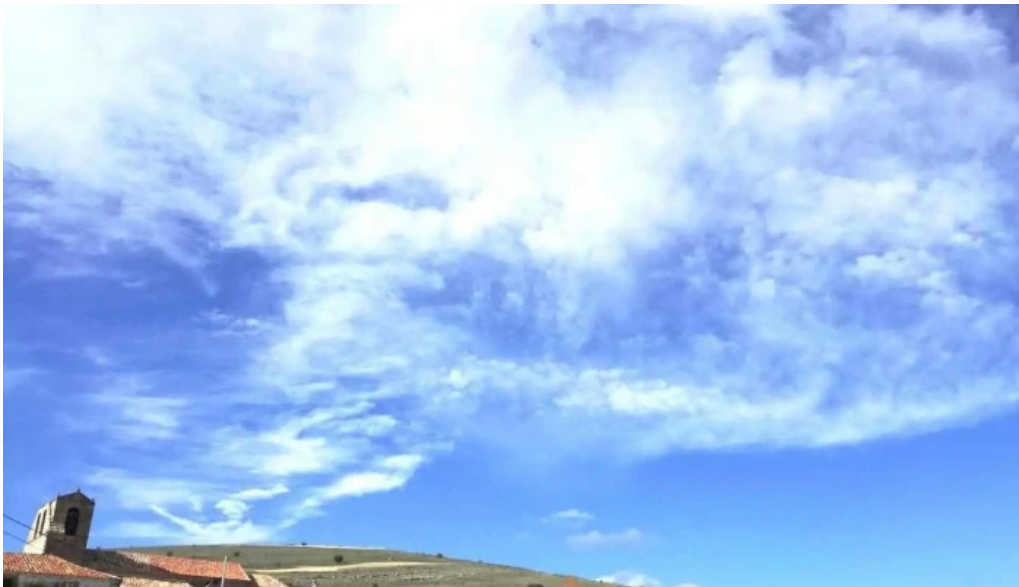
Iglesia de santo domingo de guzman fuentelsaz de soria