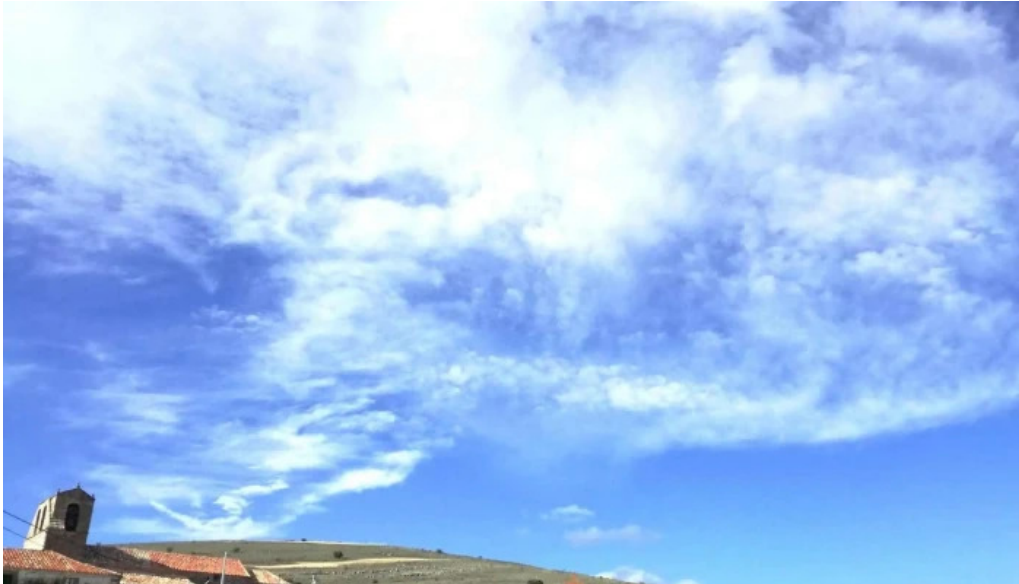
Iglesia de santo domingo de guzman iglesia