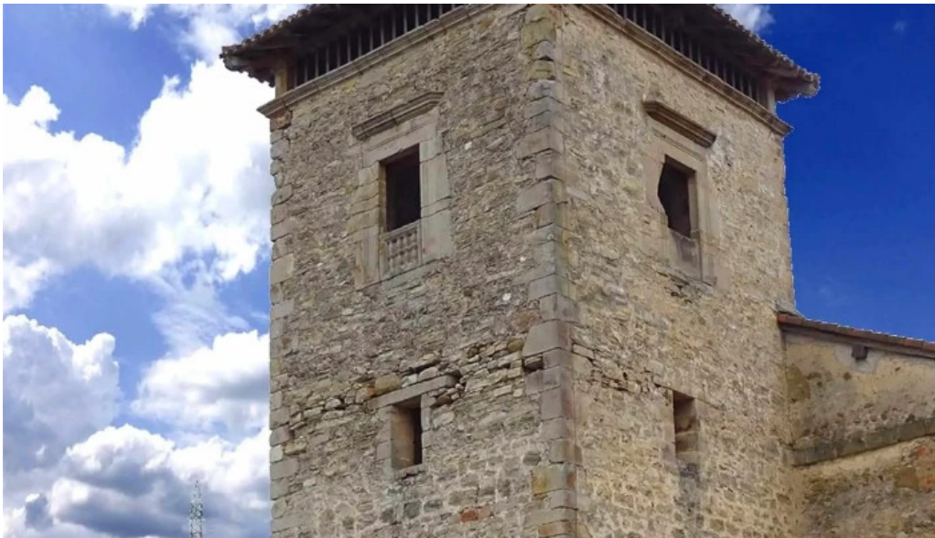
Salbatore eleiza numero