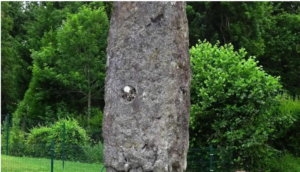
Salbatore eleiza puntaje