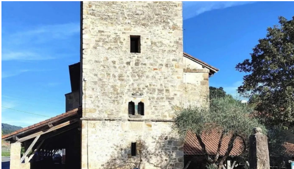
Salbatore eleiza iglesia