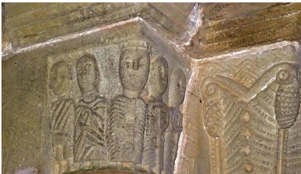
Salbatore eleiza catalogo