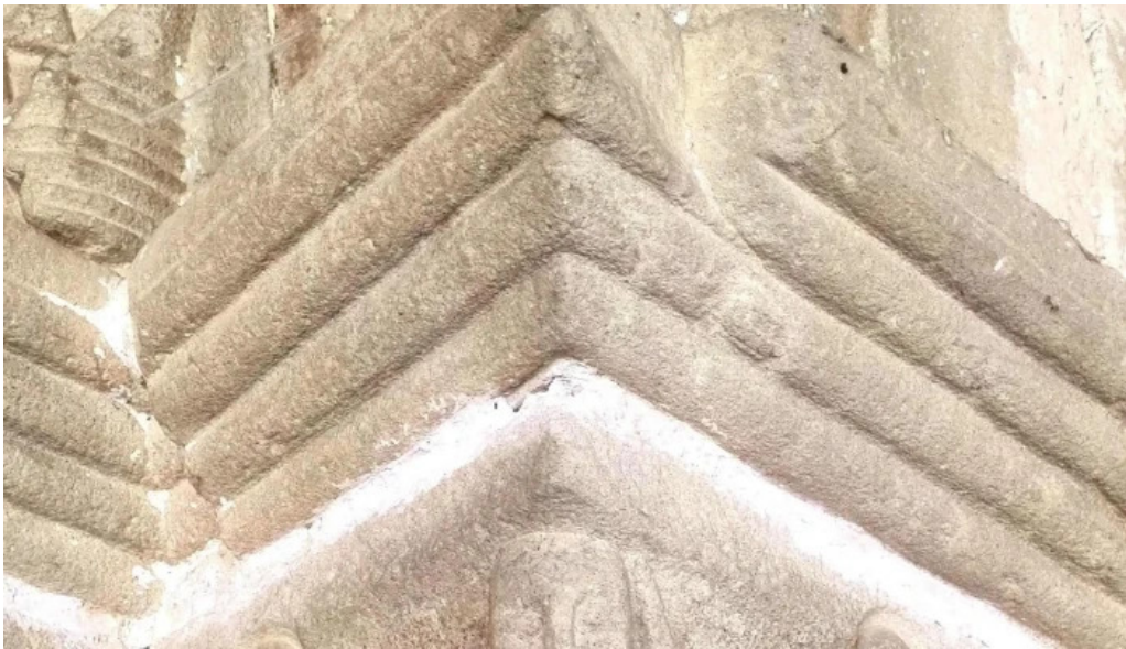
Salbatore eleiza comentarios