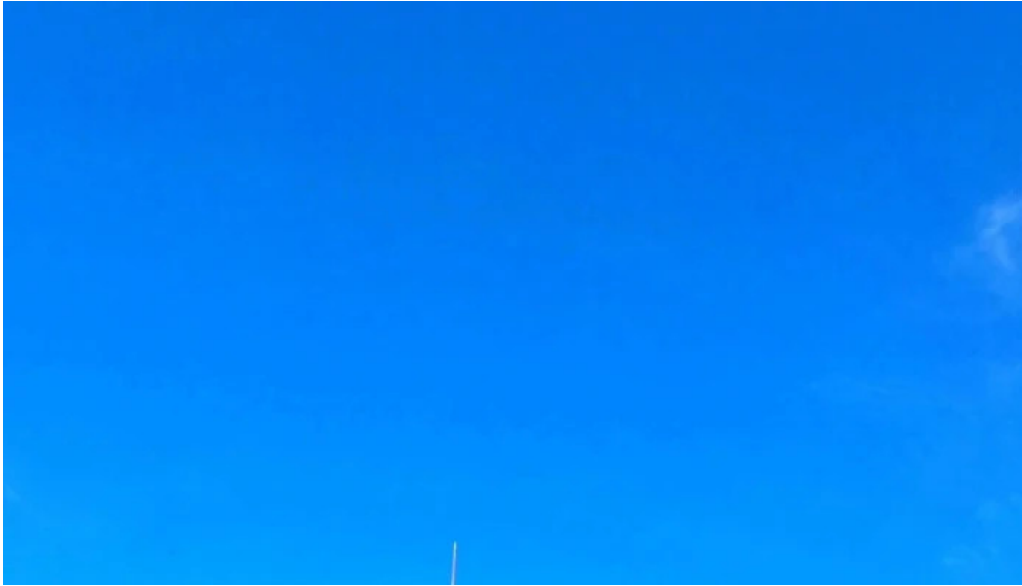
Salbatore eleiza horario