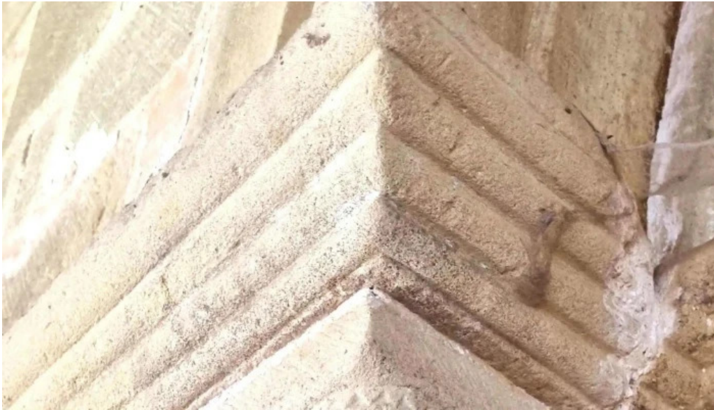
Salbatore eleiza fruiz