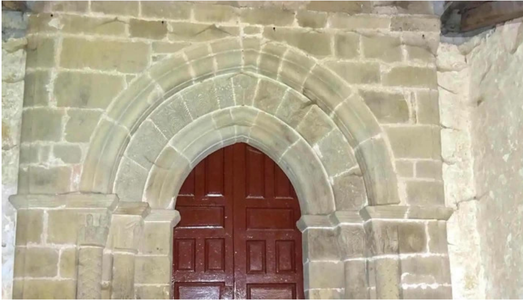
Salbatore eleiza promoci3n