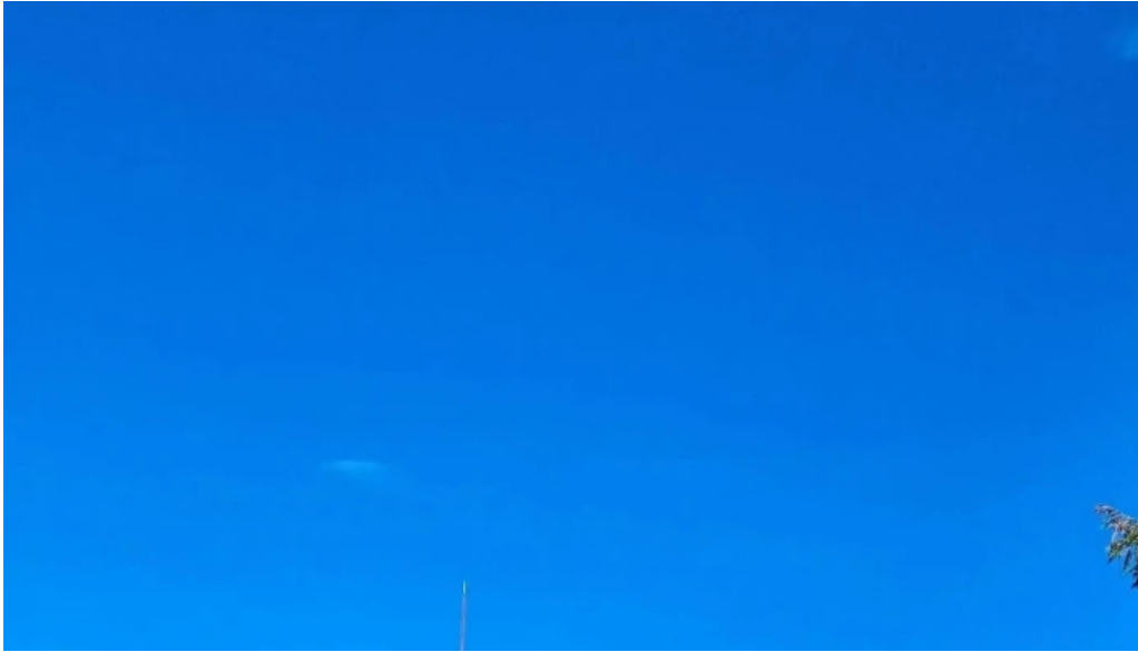
Salbatore eleiza direccion