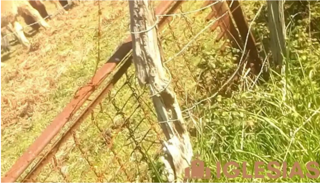
Salbatore eleiza videos