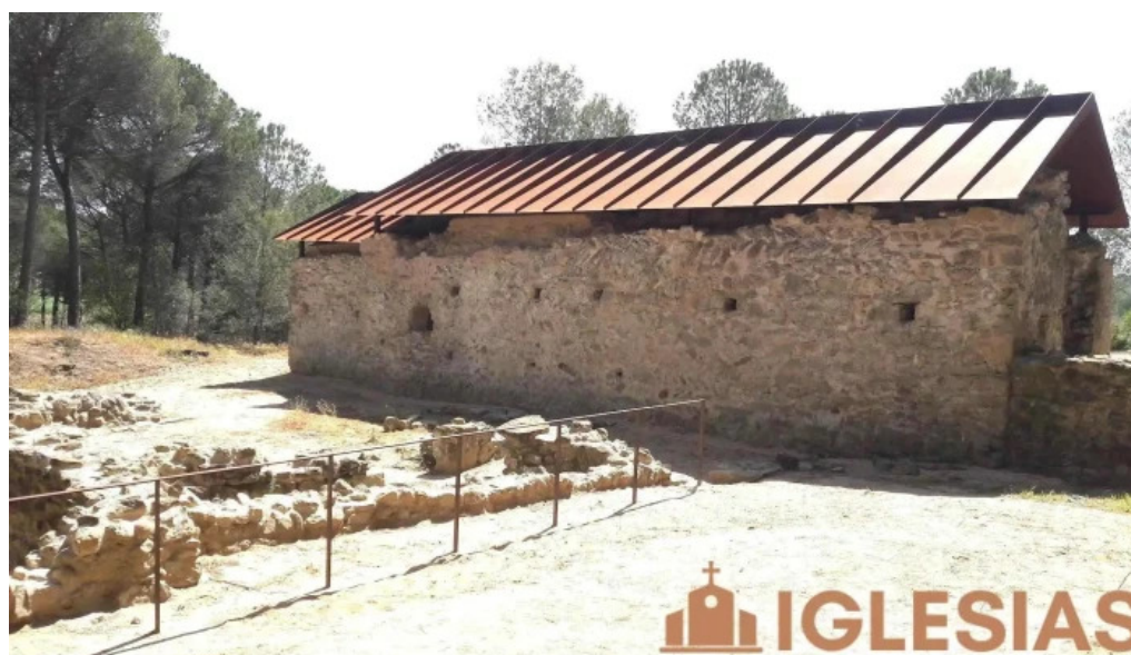
Iglesia de sant roma iglesia