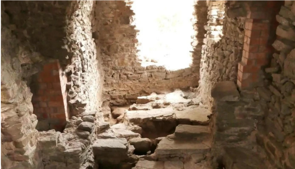
Iglesia de sant roma foixa