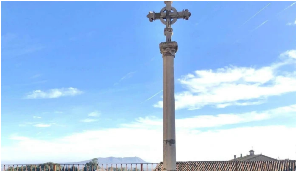
Iglesia de san juan de foixa precios