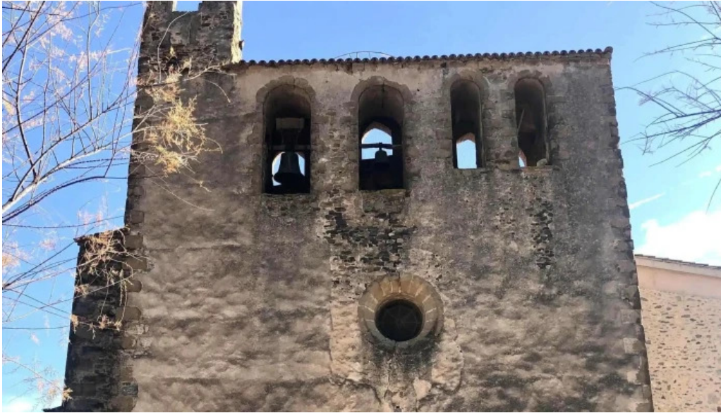
Iglesia de san juan de foixa viejos