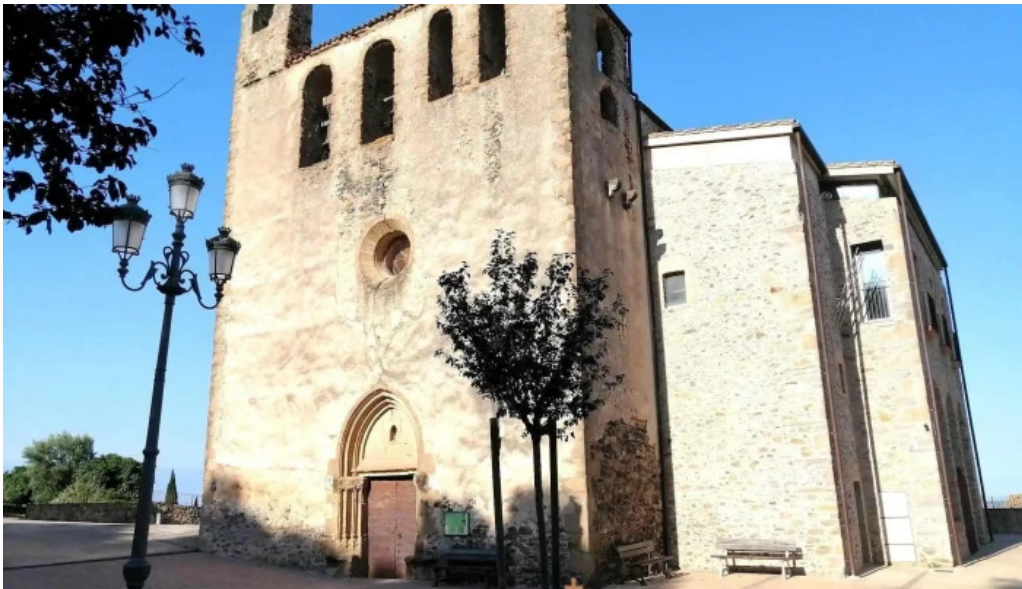
Iglesia de san juan de foixa iglesia