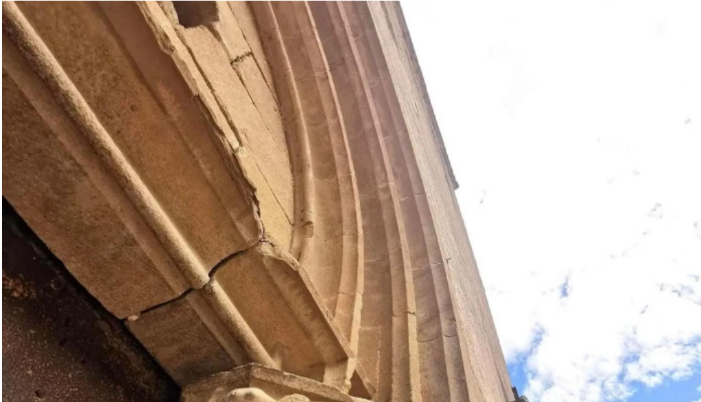
Iglesia de san juan de foixa comentarios