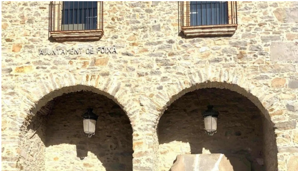
Iglesia de san juan de foixa horario