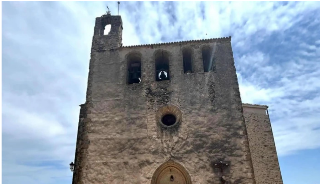
Iglesia de san juan de foixa foixa