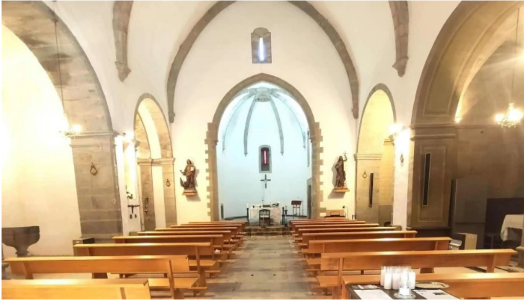
Iglesia de san juan de foixa instagram