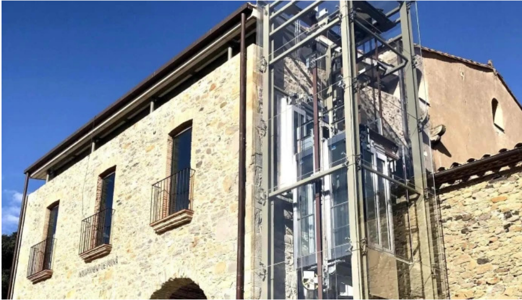
Iglesia de san juan de foixa opiniones