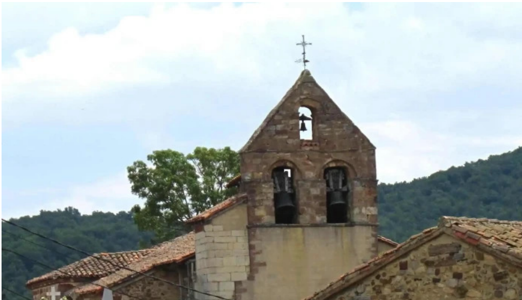
Iglesia de nuestra senora de la asuncion direccion