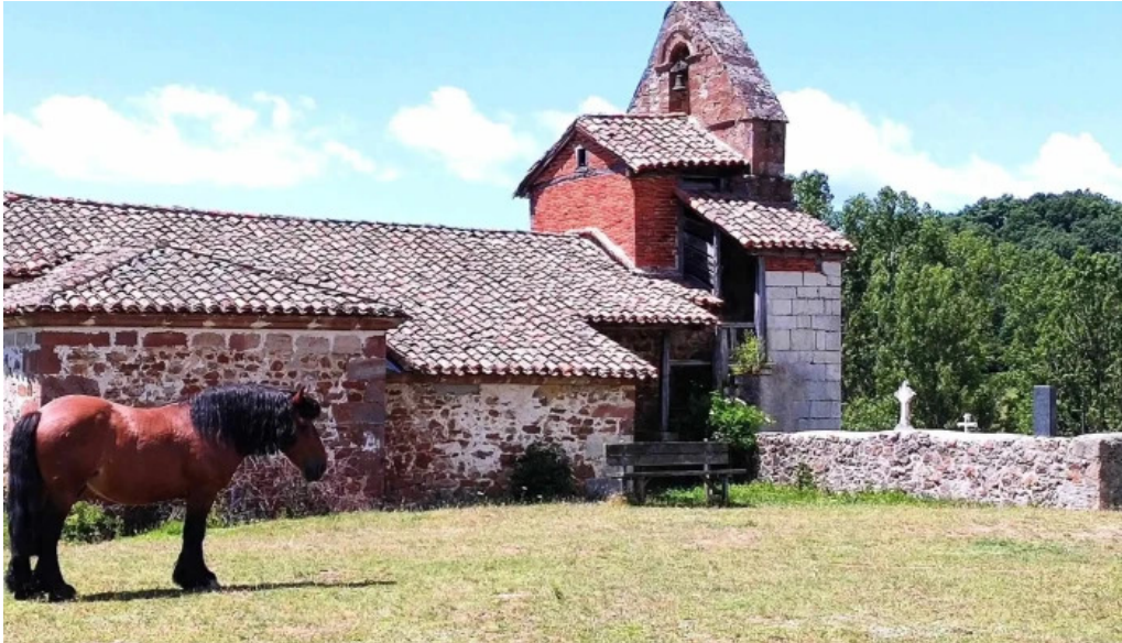
Iglesia de nuestra senora de la asuncion estalaya