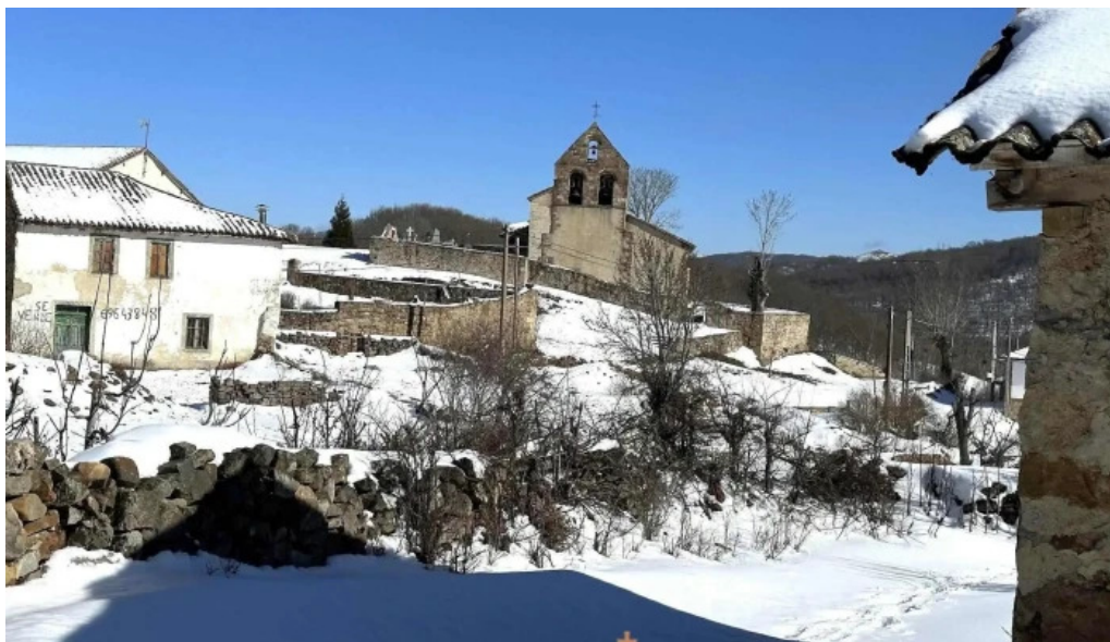
Iglesia de nuestra senora de la asuncion iglesia