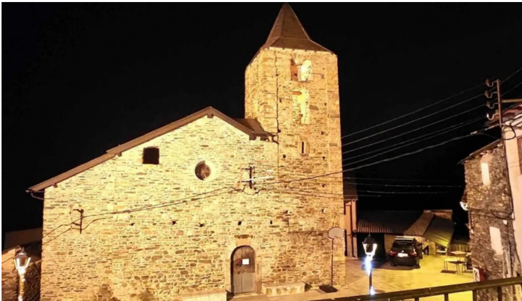
Iglesia de san julian de espui ubicacion