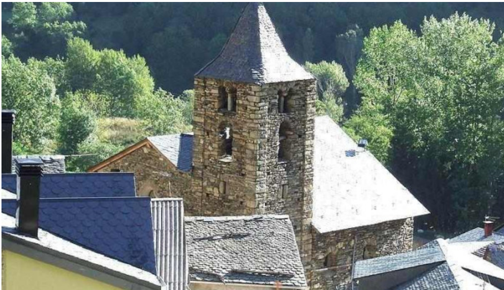
Iglesia de san julian de espui iglesia