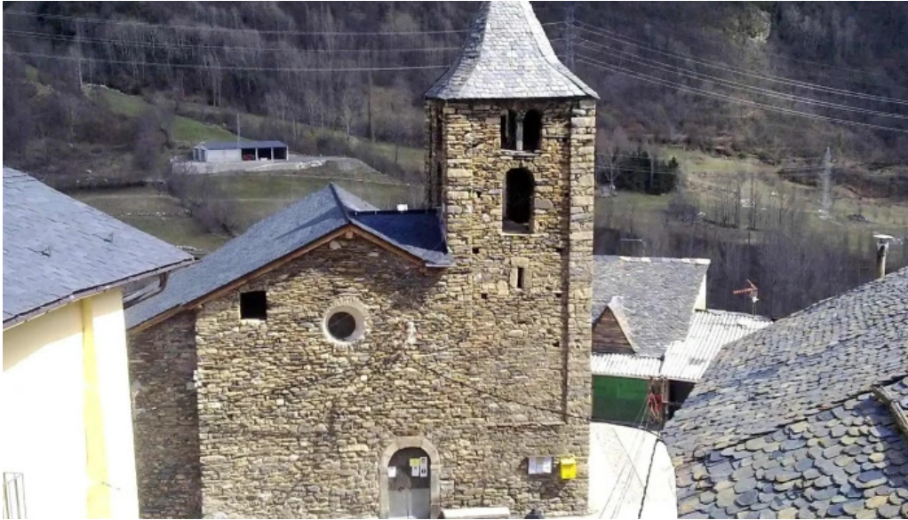
Iglesia de san julian de espui zona