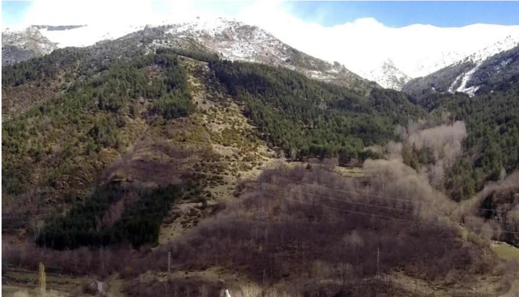
Iglesia de san julian de espui espui