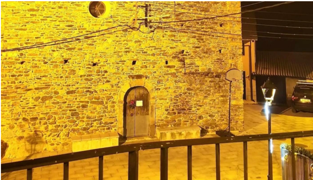
Iglesia de san julian de espui como llegar