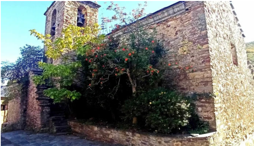
Iglesia de san miguel iglesia