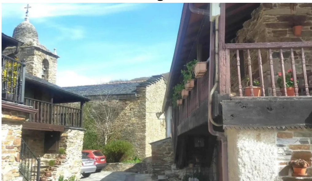
Iglesia de san miguel puntaje