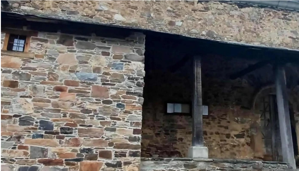
Iglesia de san miguel espinoso de compludo