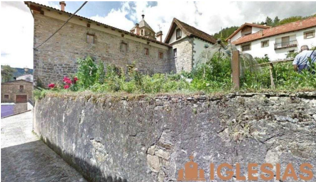
Iglesia de san andres esparza de salazar