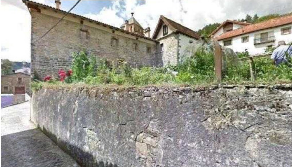
Iglesia de san andres iglesia