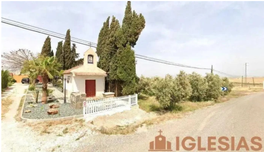
Ermita nuestra senora del perpetuo socorro escuzar