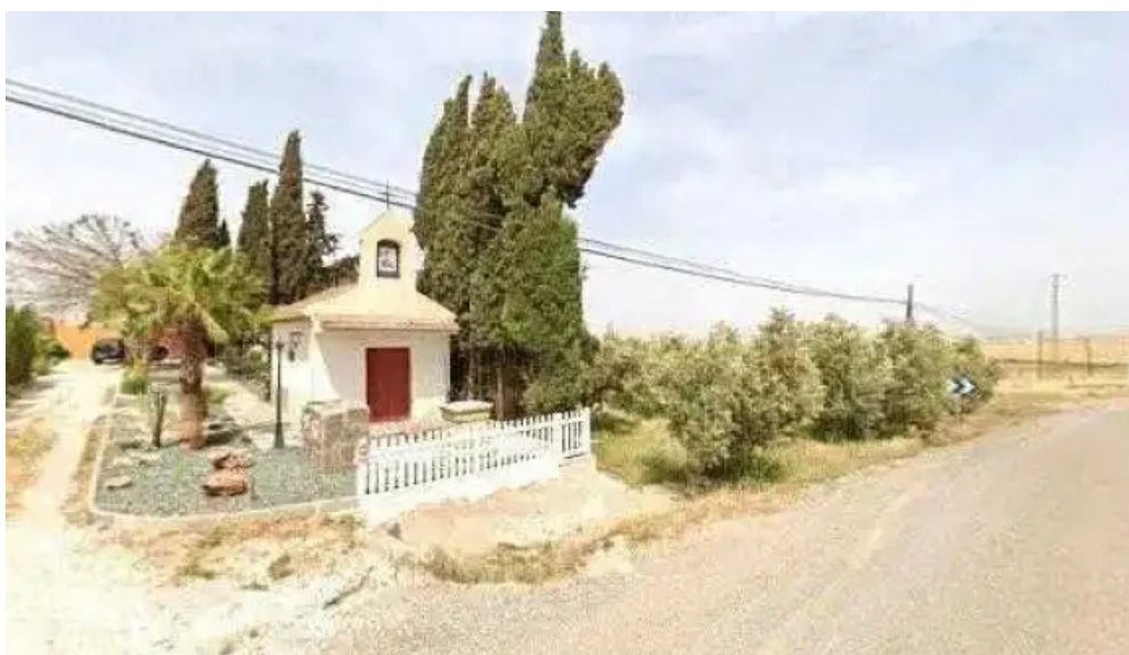
Ermita nuestra senora del perpetuo socorro iglesia