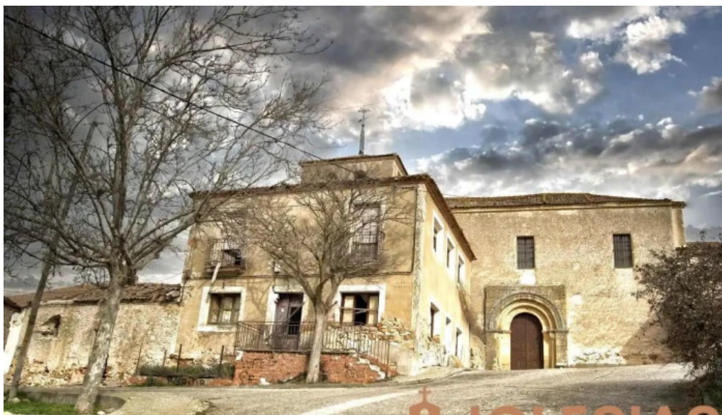
Iglesia de la purificacion de nuestra senora escobar de polendos