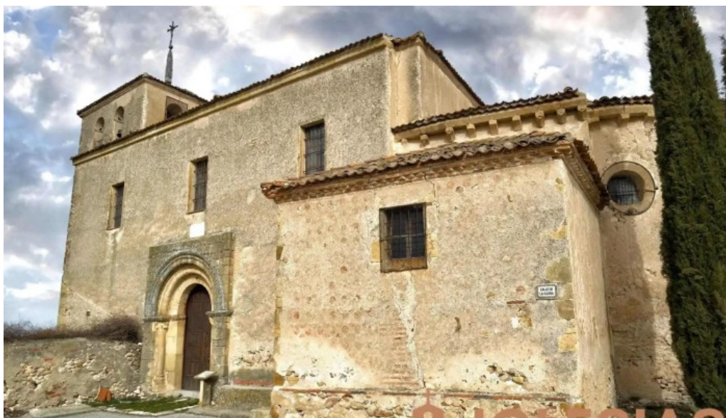
Iglesia de la purificacion de nuestra senora iglesia