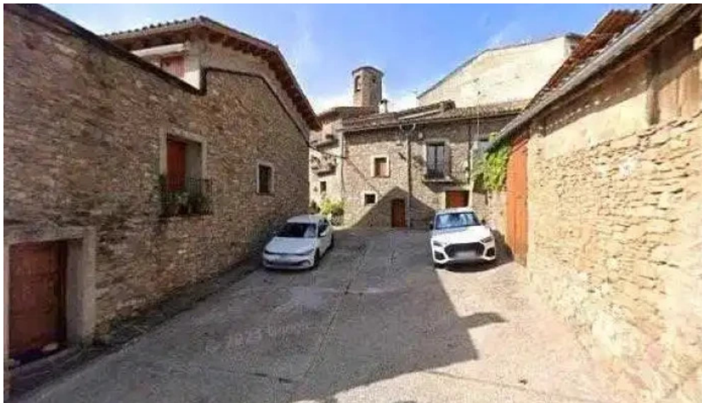
Sant esteve derinya opiniones