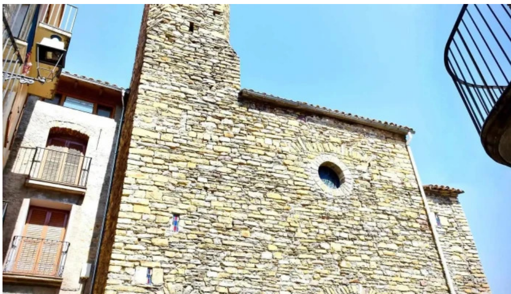
Sant esteve derinya iglesia