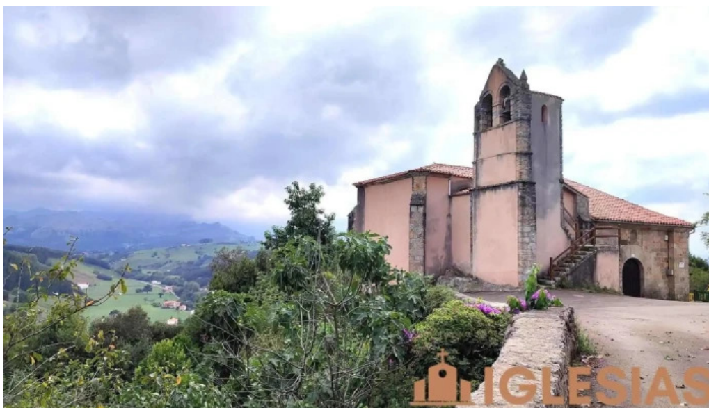
Iglesia de santa marina entrambasaguas