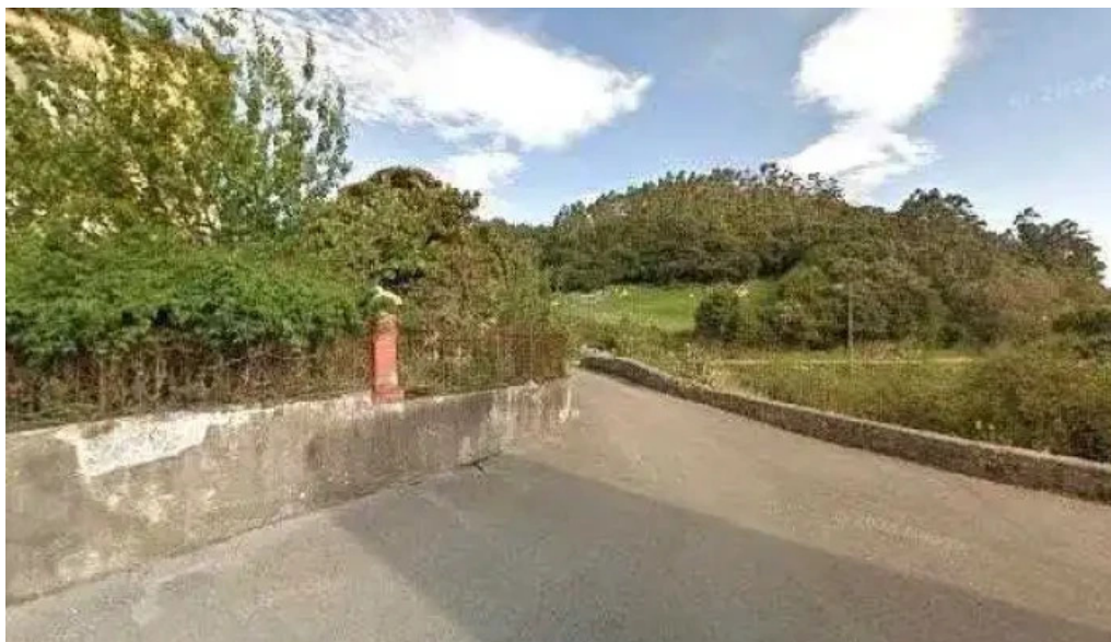
Iglesia de santa marina videos