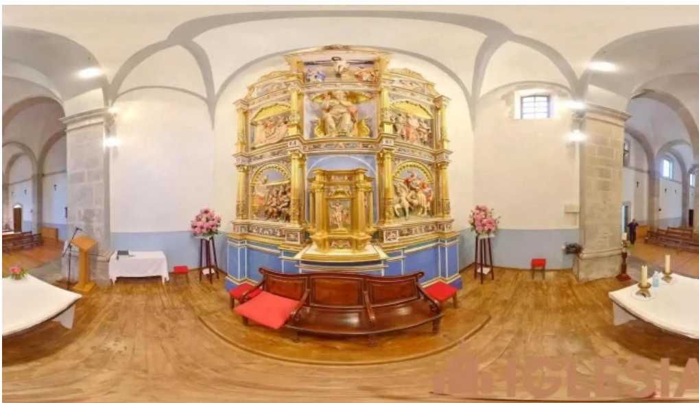
Iglesia de san martin obispo elexalde