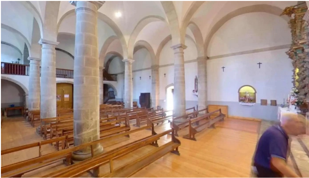
Iglesia de san martin obispo iglesia