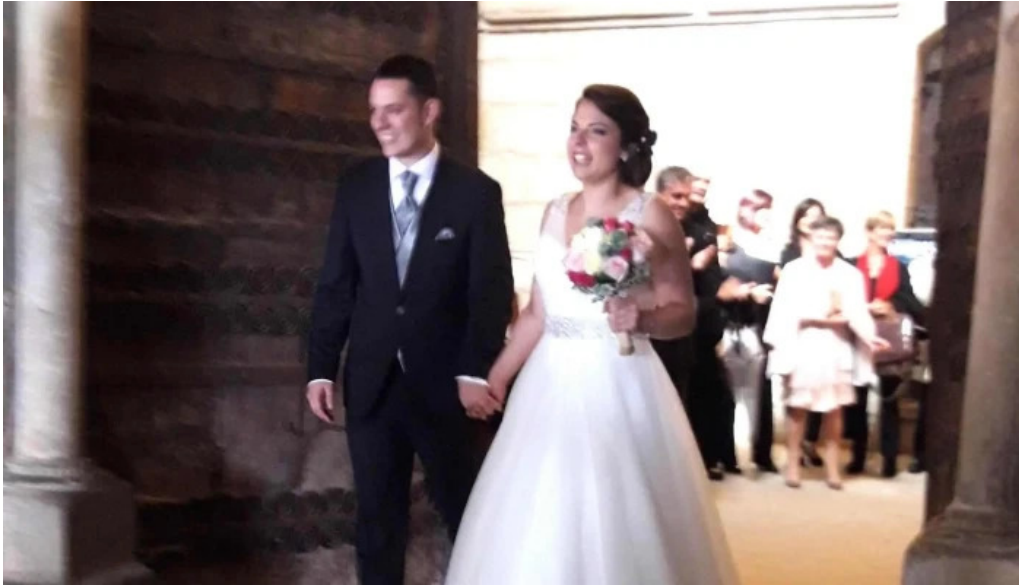
Iglesia de andra mari elexalde precios