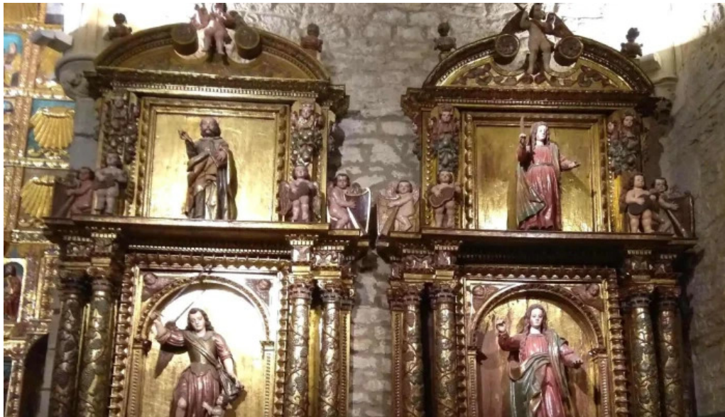
Iglesia de andra mari elexalde elexalde auzoa