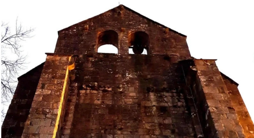
Iglesia de andra mari elexalde videos