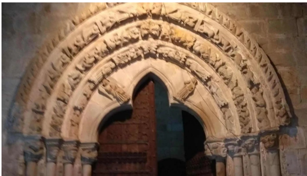
Iglesia de andra mari elexalde descuentos