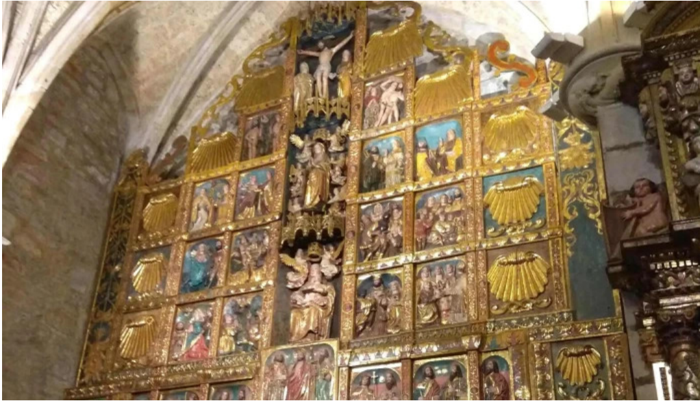
Iglesia de andra mari elexalde ubicacion