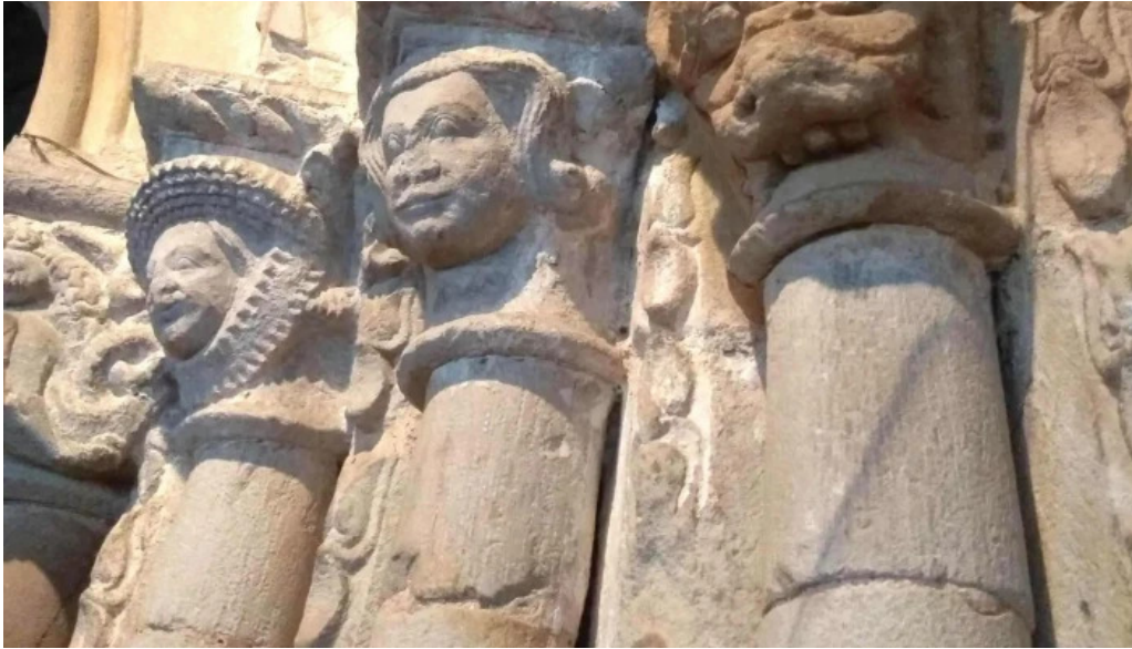
Iglesia de andra mari elexalde instagram