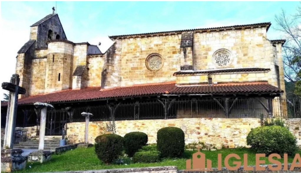
Iglesia de andra mari elexalde iglesia