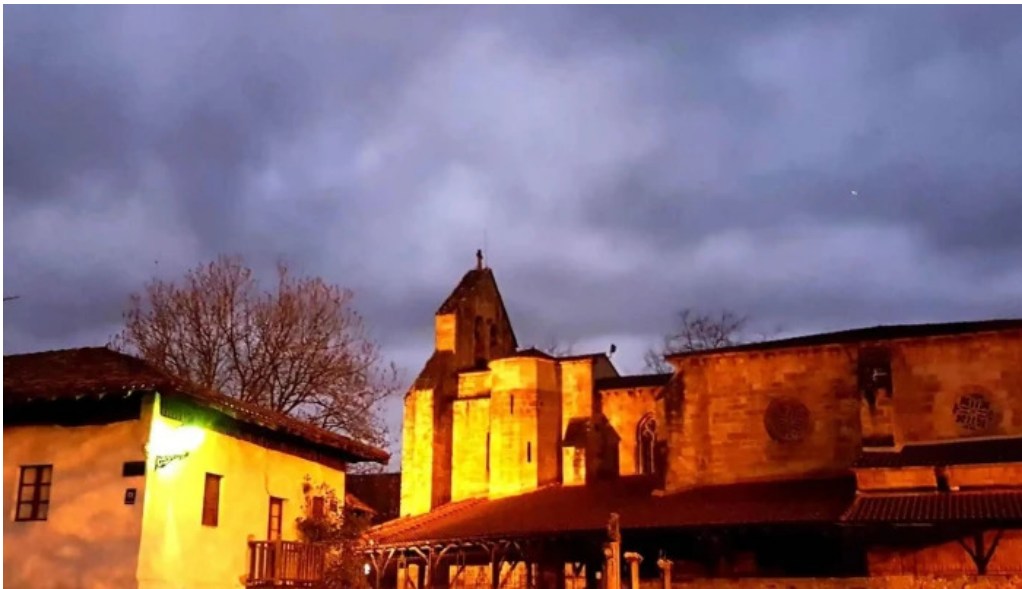
Iglesia de andra mari elexalde sitio web