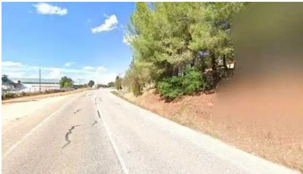
Ermita de san isidro iglesia