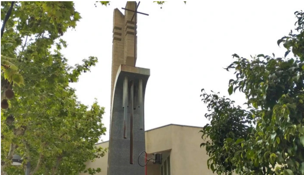
Iglesia de santa maria fotos