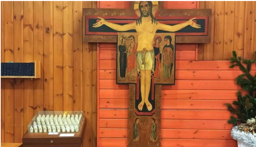
Iglesia de santa maria iglesia