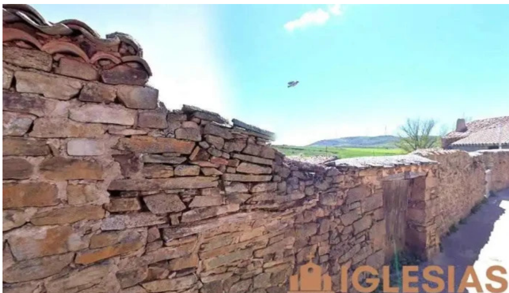
Iglesia de san benito el espino