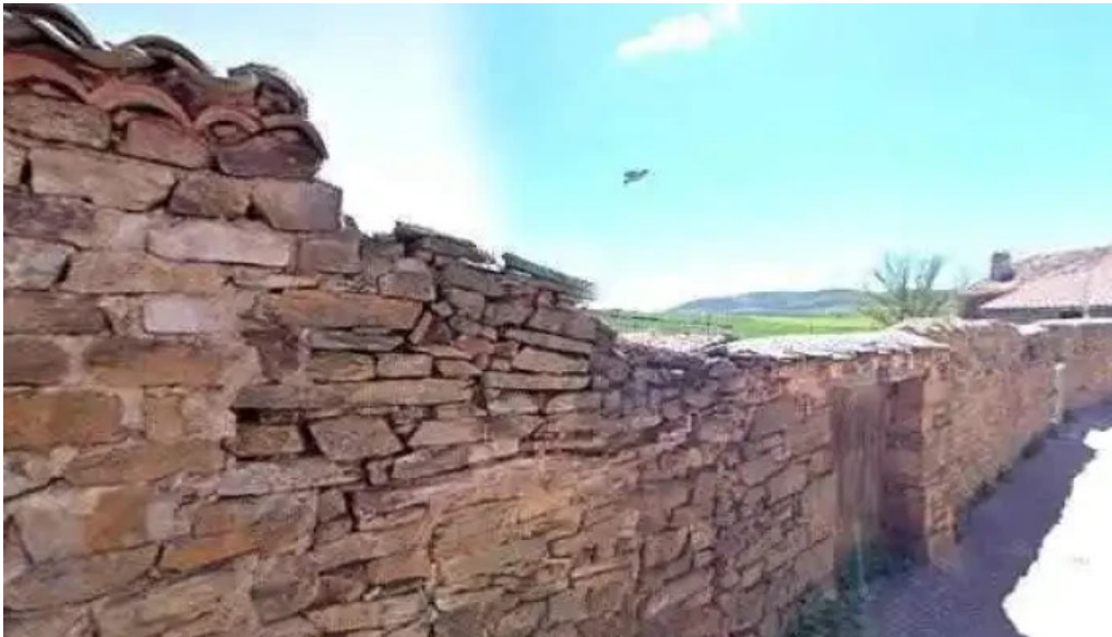
Iglesia de san benito iglesia