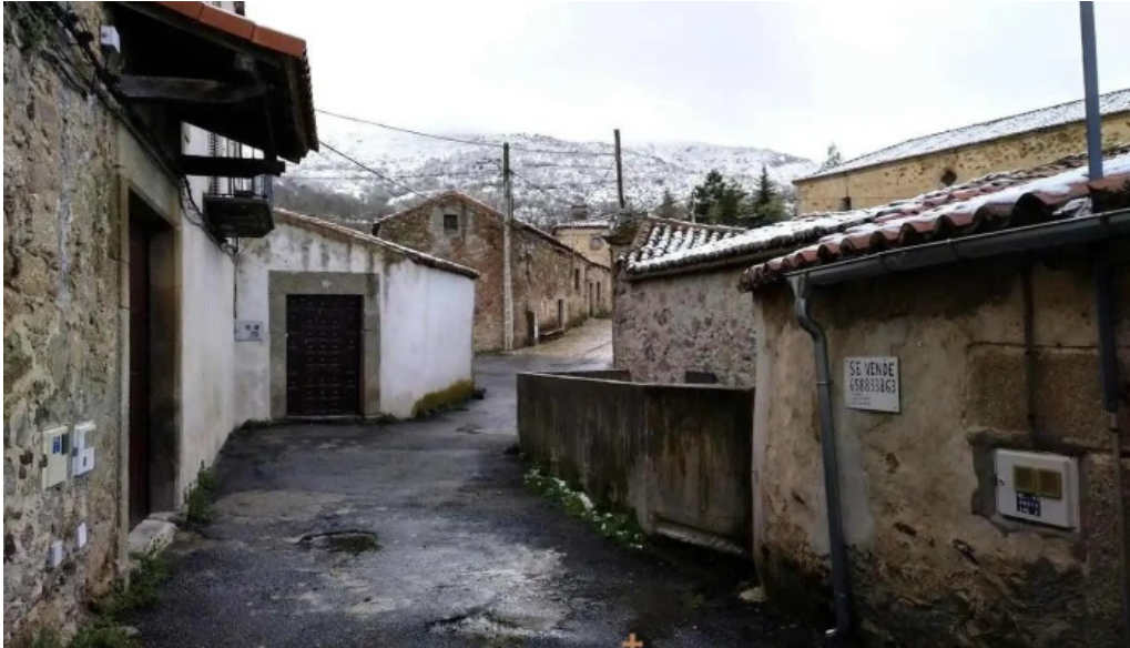
Iglesia del cristo de la humildad el barrio