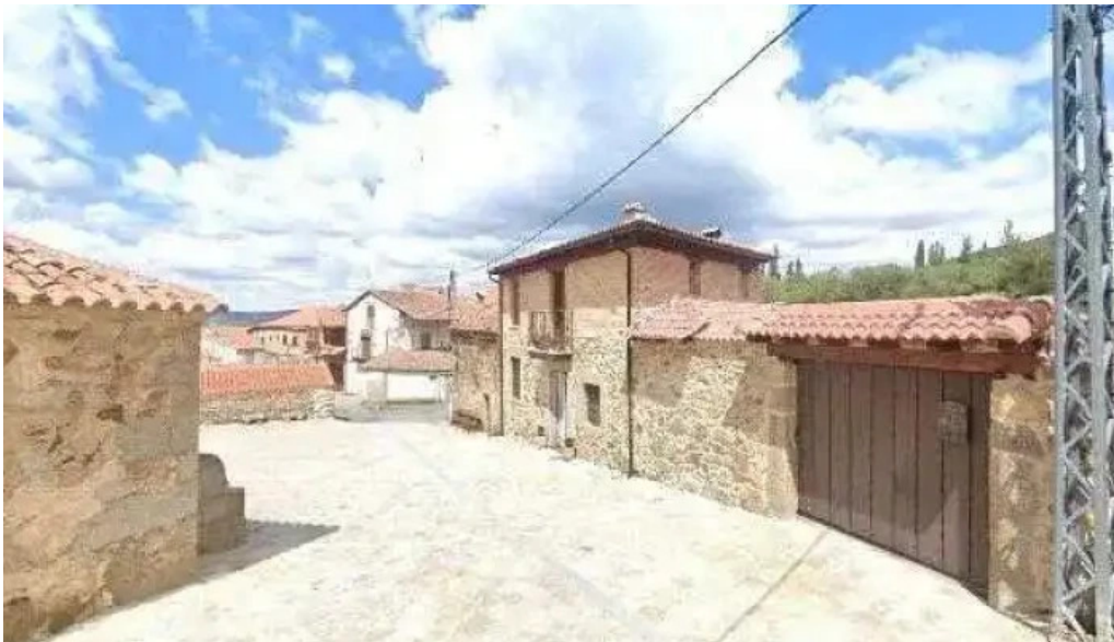
Iglesia del cristo de la humildad catalogo