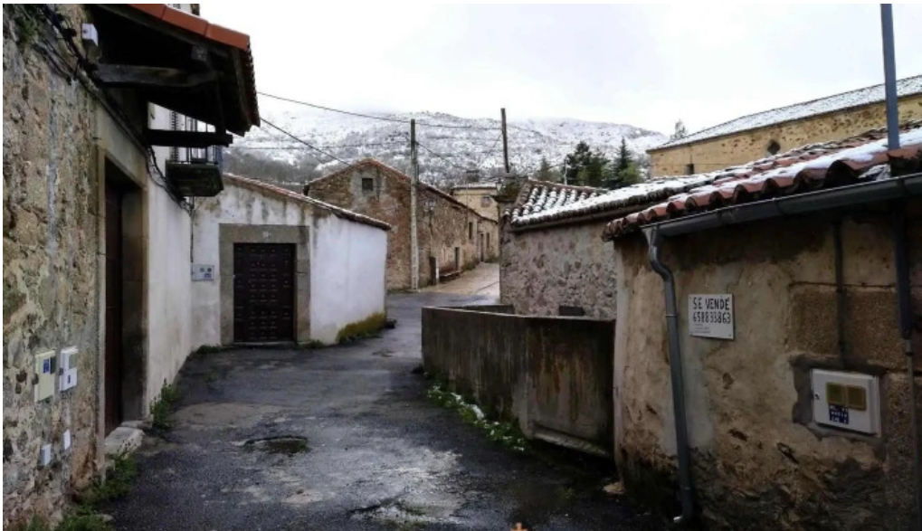
Iglesia del cristo de la humildad iglesia