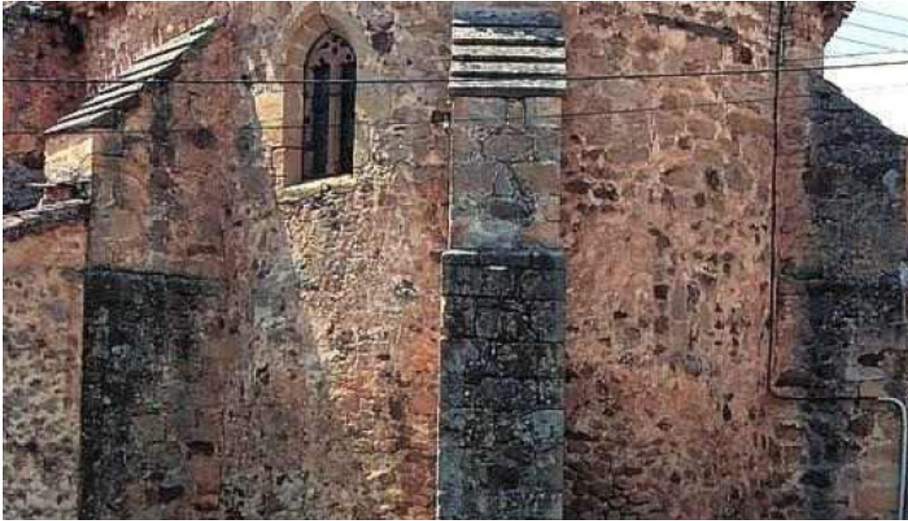
Iglesia de san juan bautista iglesia