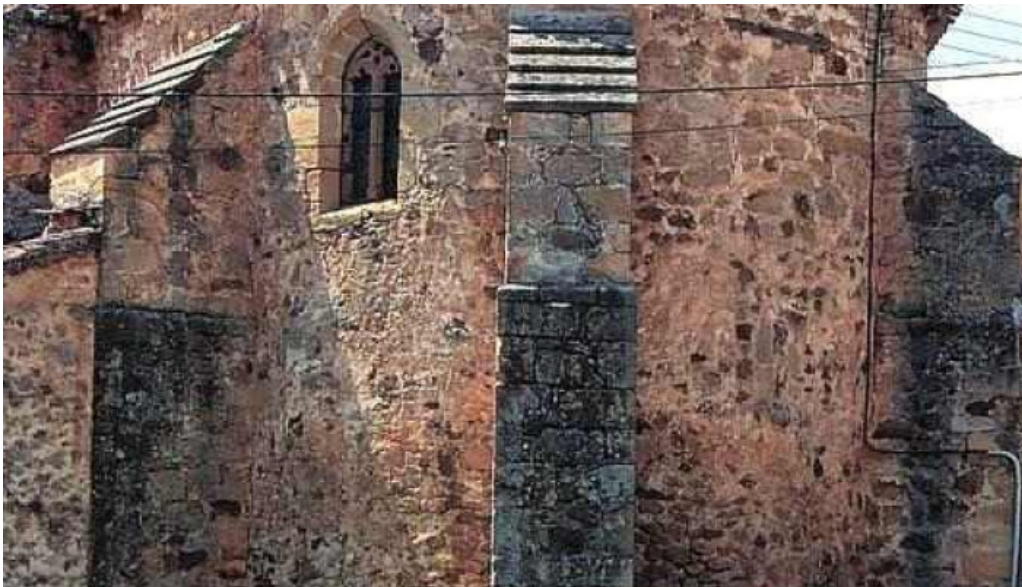
Iglesia de san juan bautista derronadas