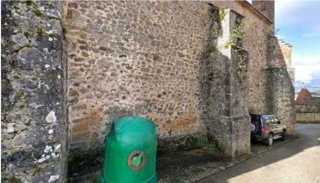
Iglesia de san juan bautista como llegar