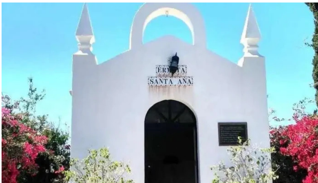
Ermita de santa ana el ejido dalias