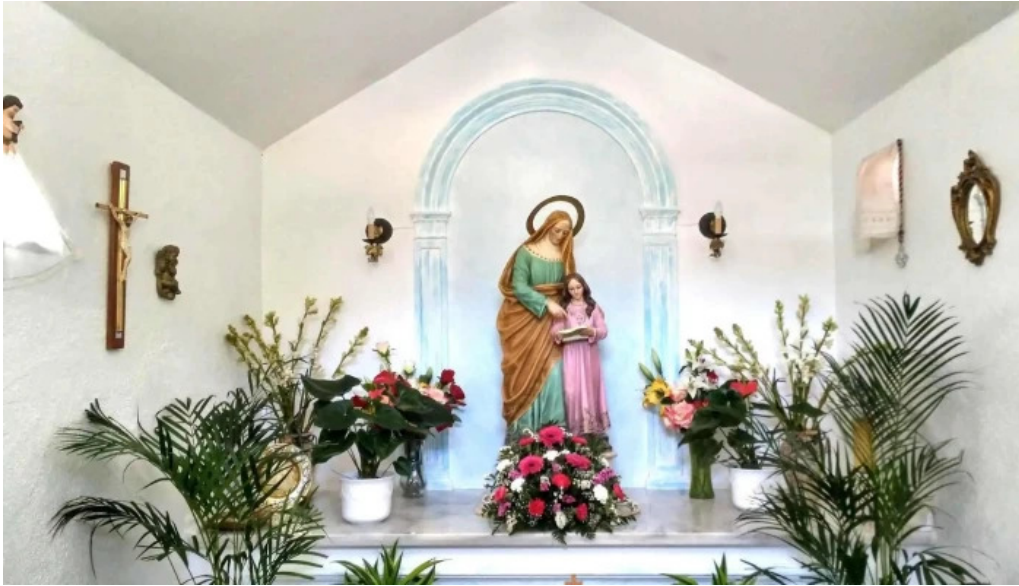
Ermita de santa ana el ejido iglesia