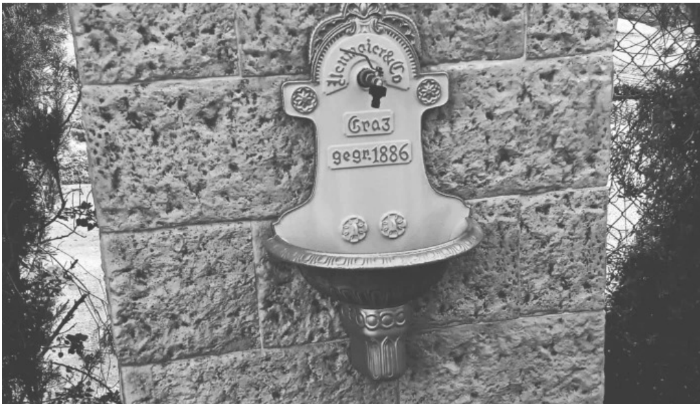
Ermita de santa ana el ejido videos