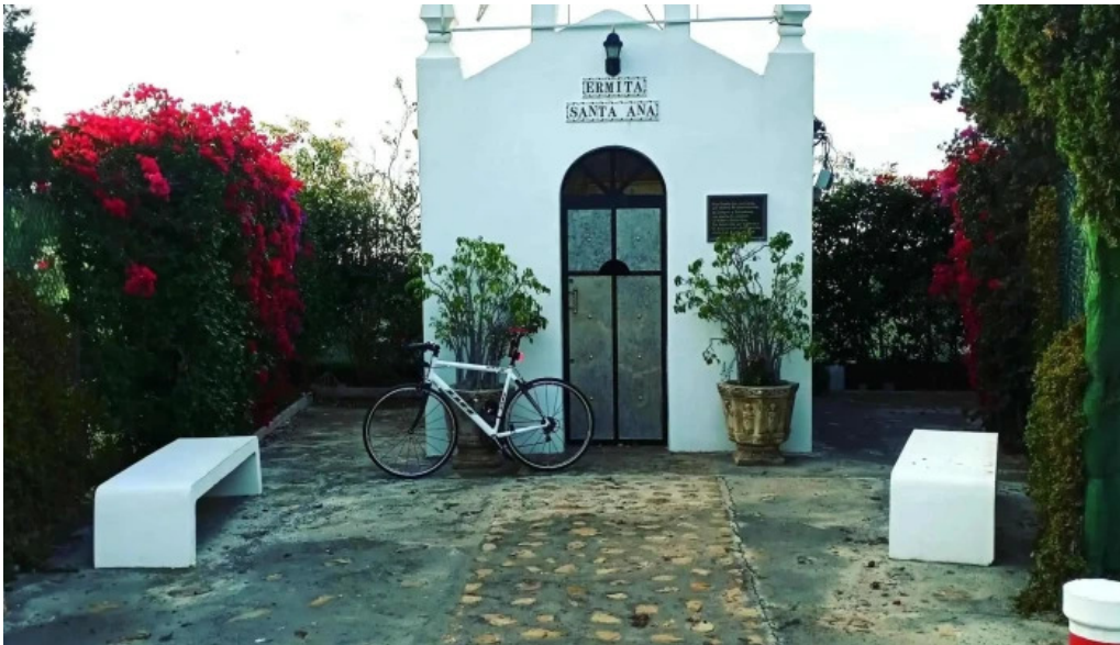
Ermita de santa ana el ejido puntaje