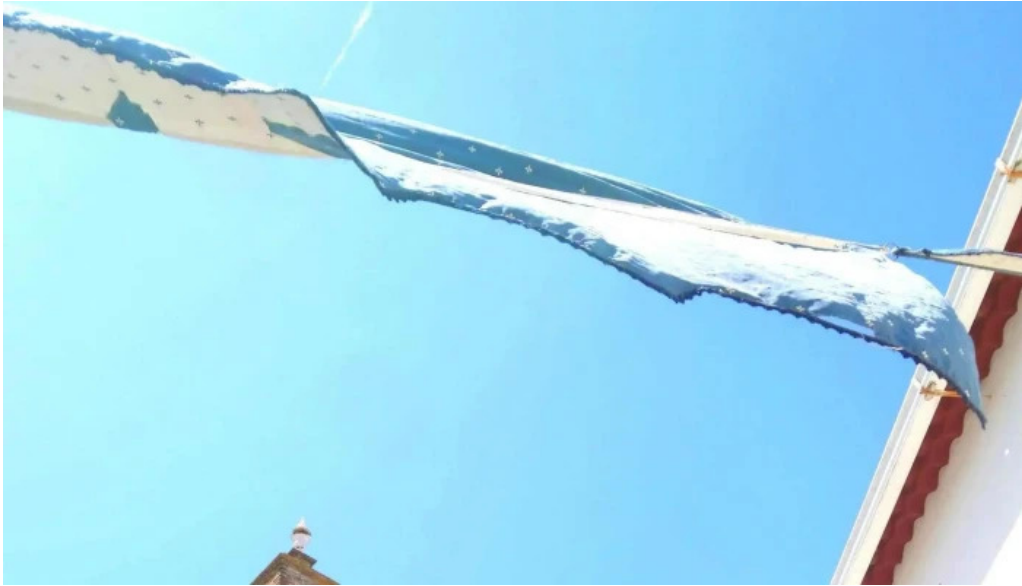
Iglesia del divino salvador ubicacion