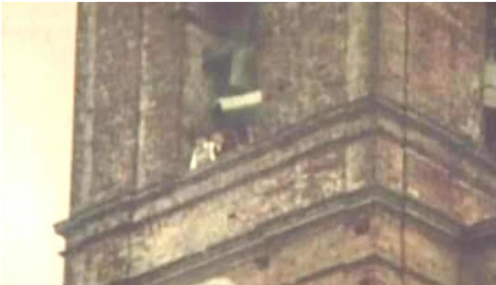
Iglesia del divino salvador abierto ahora