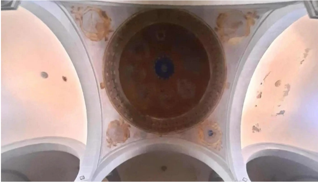
Iglesia del divino salvador horario