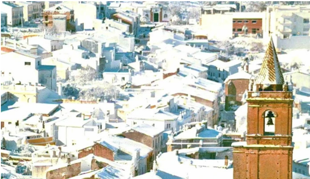
Iglesia del divino salvador precios