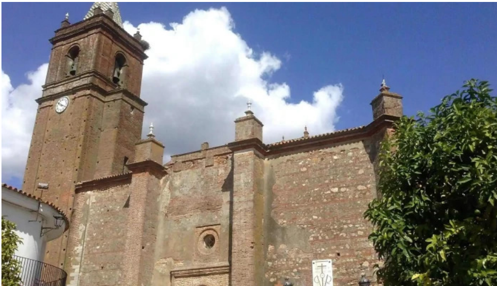
Iglesia del divino salvador del propietario