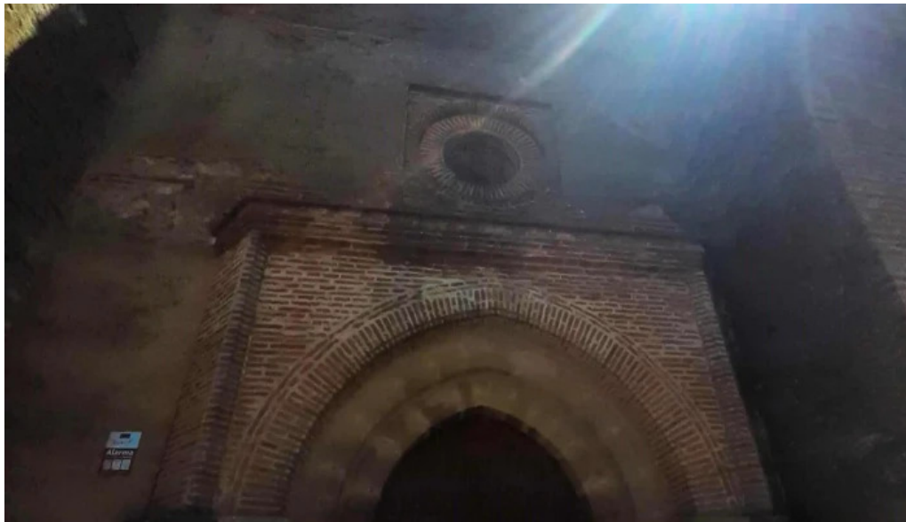
Iglesia del divino salvador cortegana