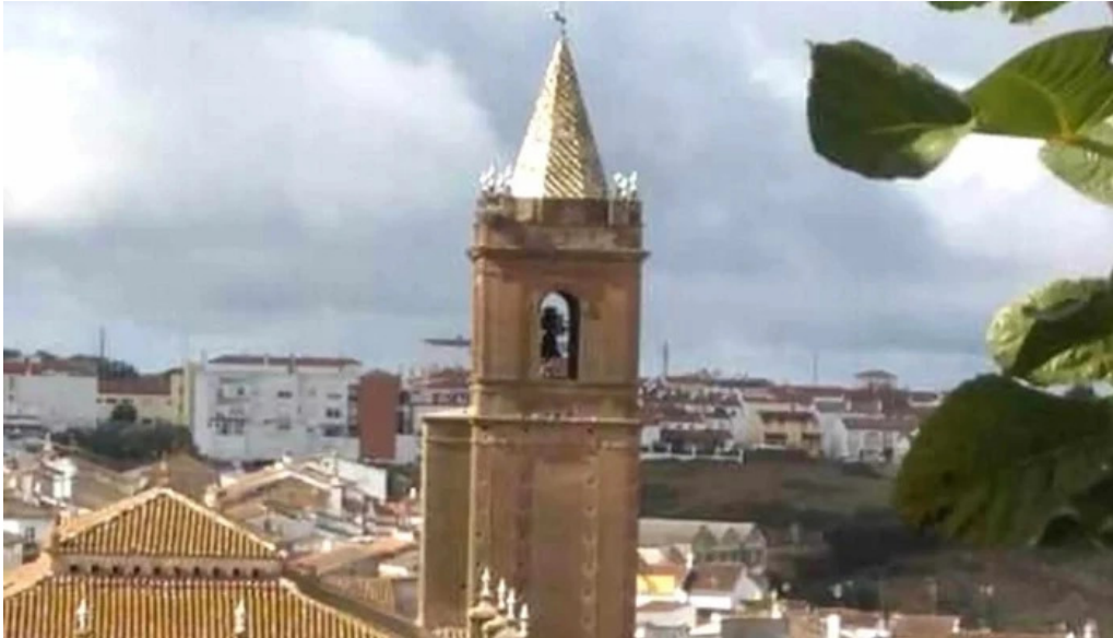
Iglesia del divino salvador comentarios