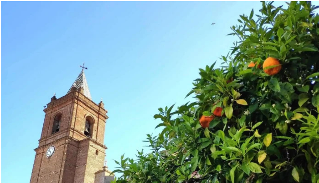
Iglesia del divino salvador telefono