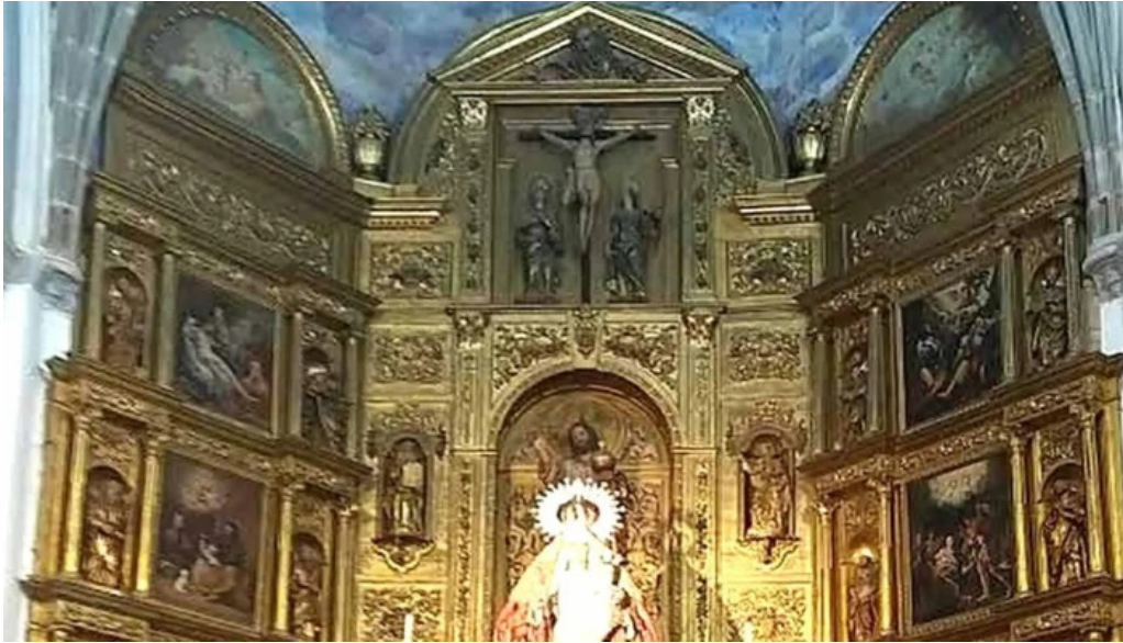
Iglesia del divino salvador descuentos