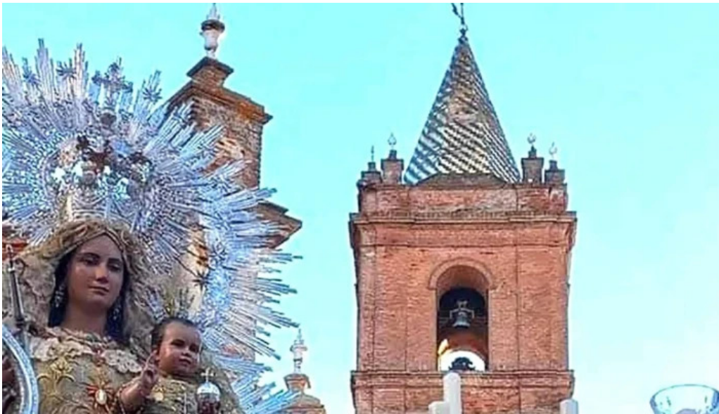
Iglesia del divino salvador fotos