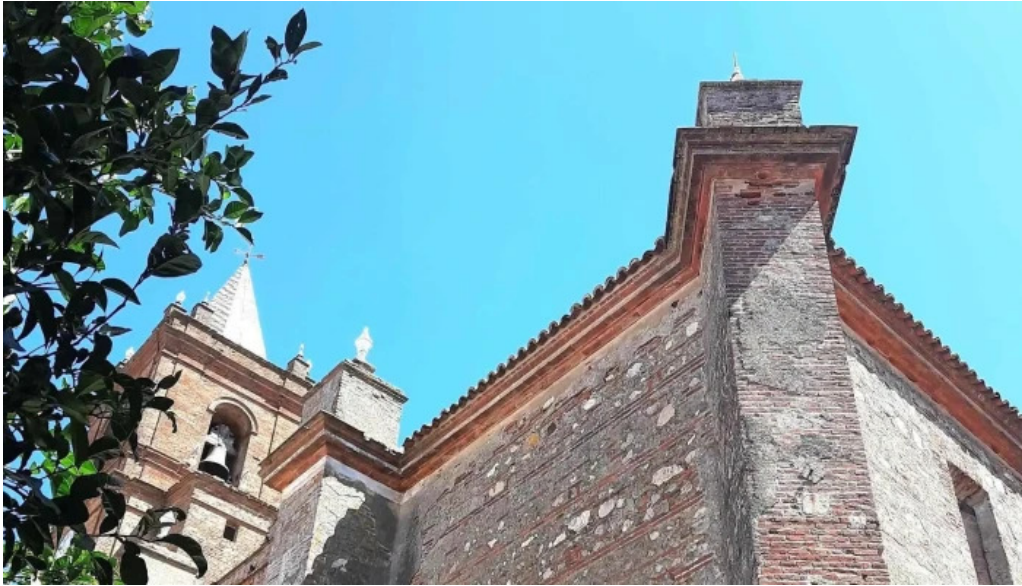
Iglesia del divino salvador sitio web