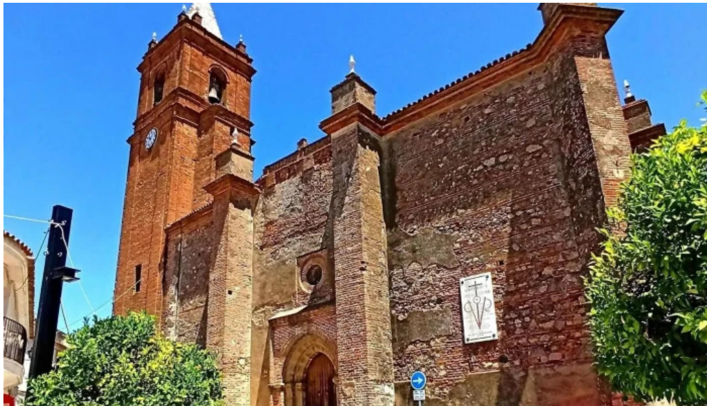
Iglesia del divino salvador iglesia