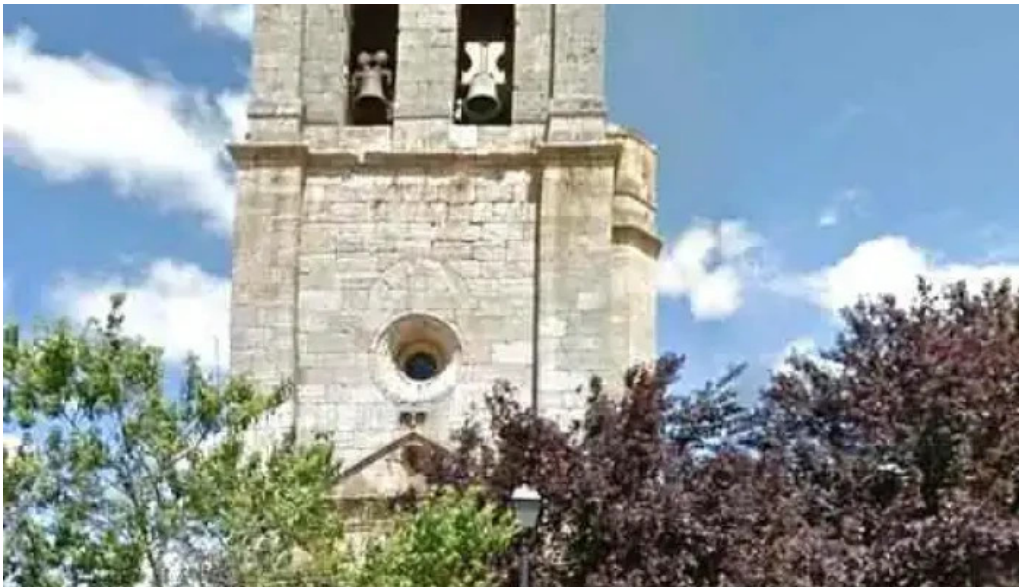
Iglesia de nuestra senora de la asuncion iglesia