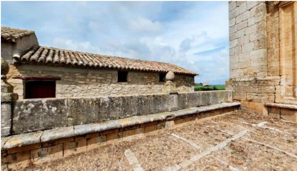
Iglesia de nuestra senora de la asuncion nuestra