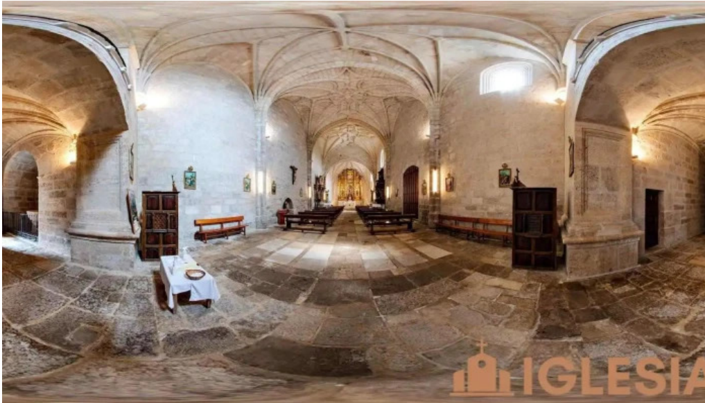
Iglesia de nuestra senora de la asuncion cordovilla la real