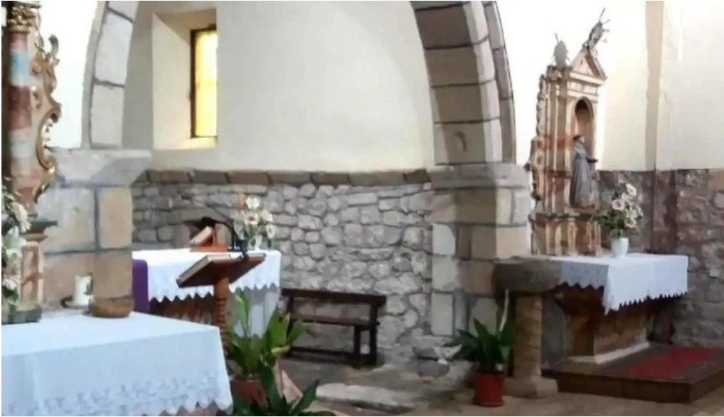
Iglesia de santa maria iglesia