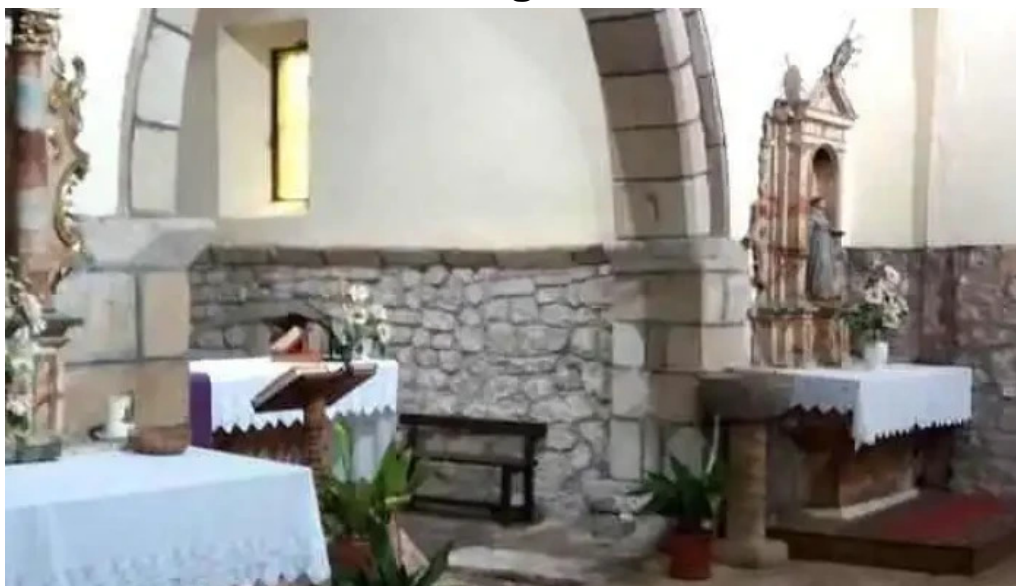
Iglesia de santa maria cohino