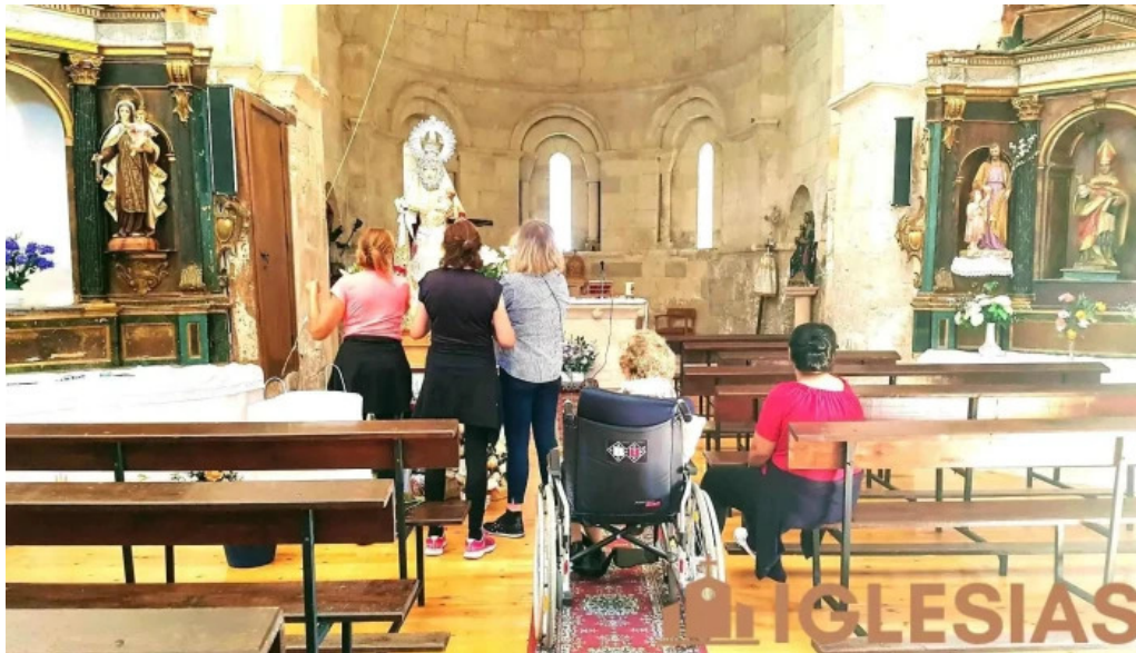
Iglesia de san julian iglesia