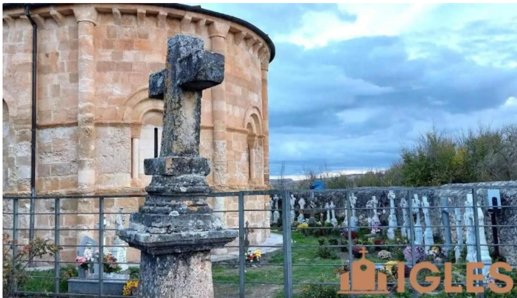
Iglesia de san julian cobos de fuentiduena