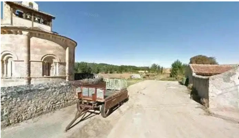
Iglesia de san julian sitio web