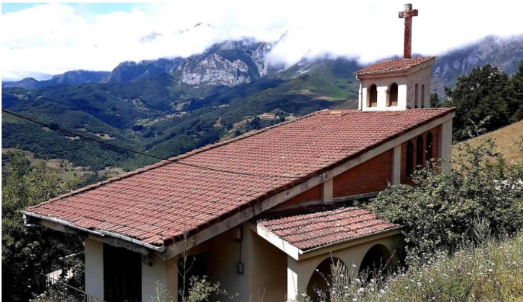
Iglesia de santa eulalia iglesia