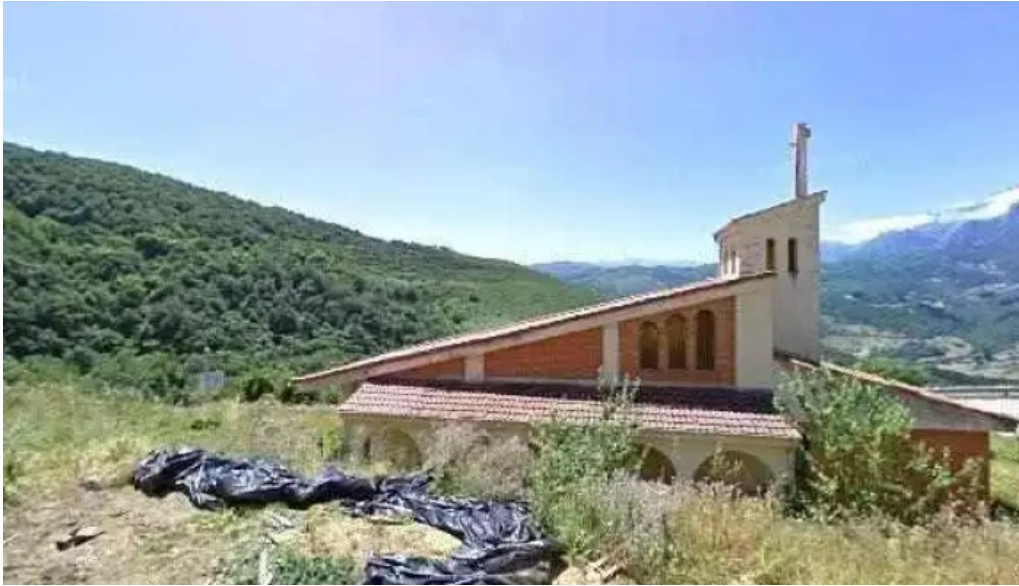
Iglesia de santa eulalia como llegar