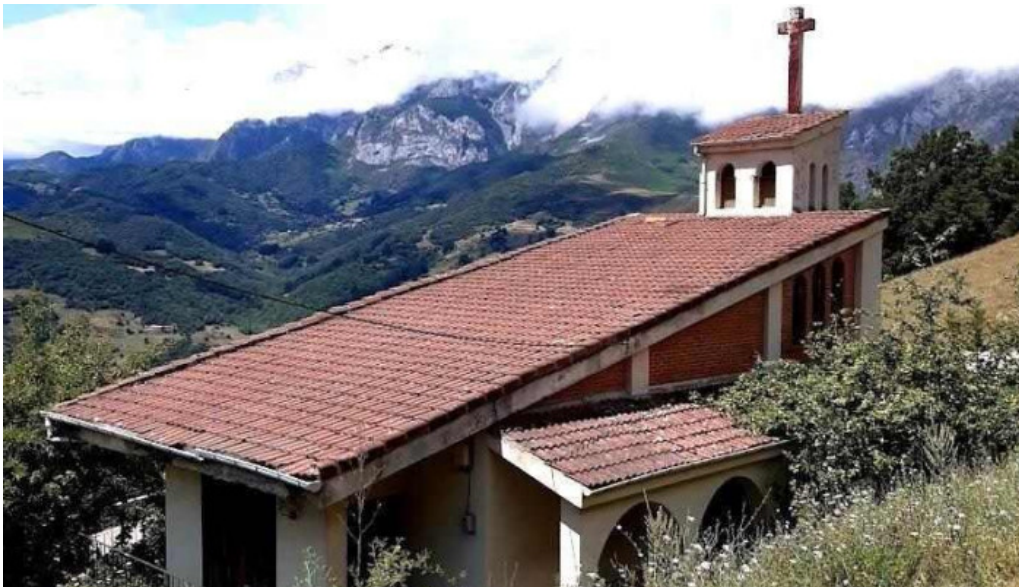
Iglesia de santa eulalia cobena