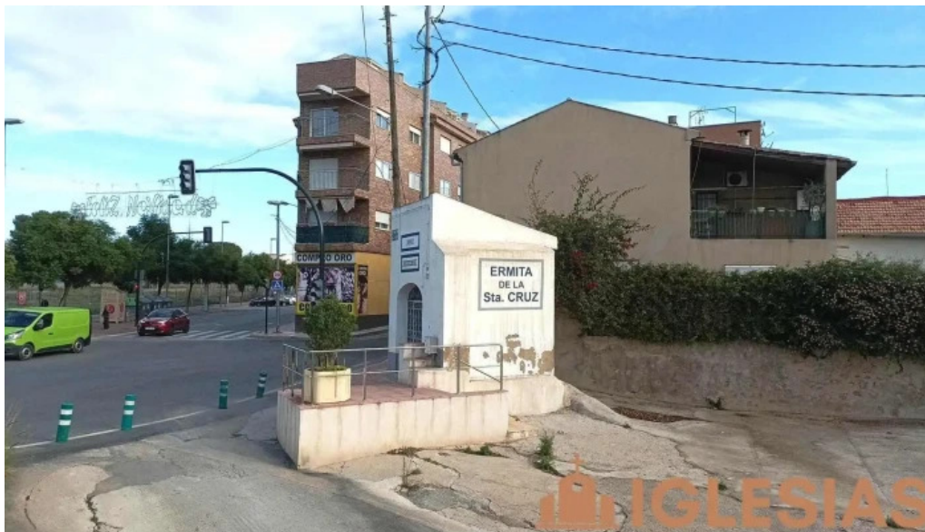
Ermita cruz de churra churra