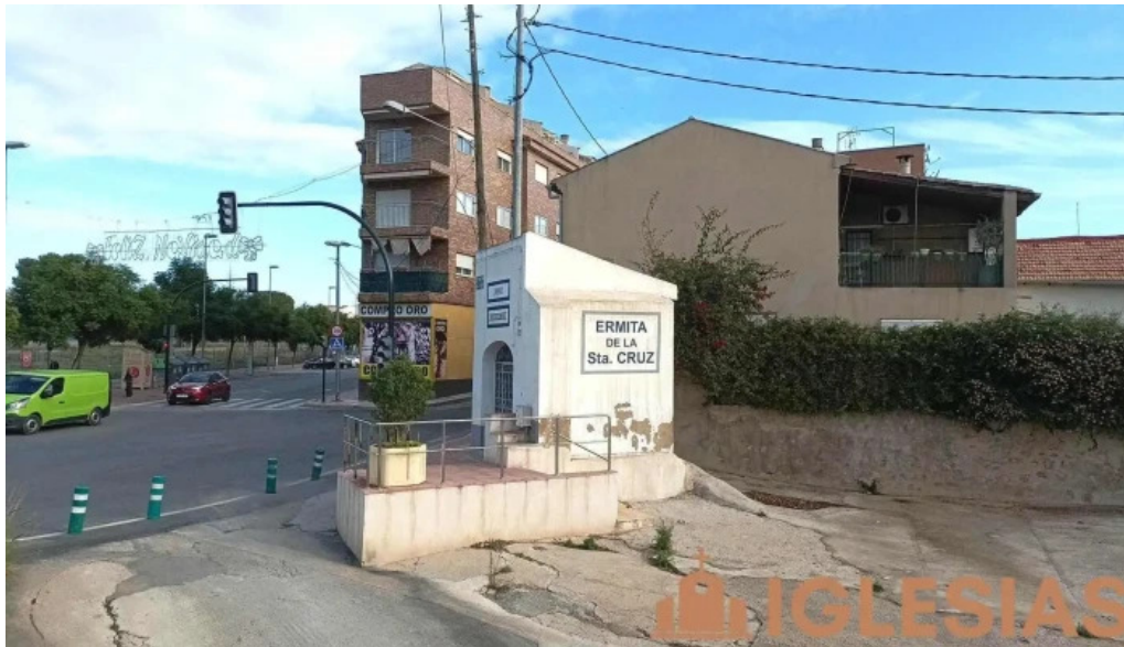
Ermita cruz de churra iglesia