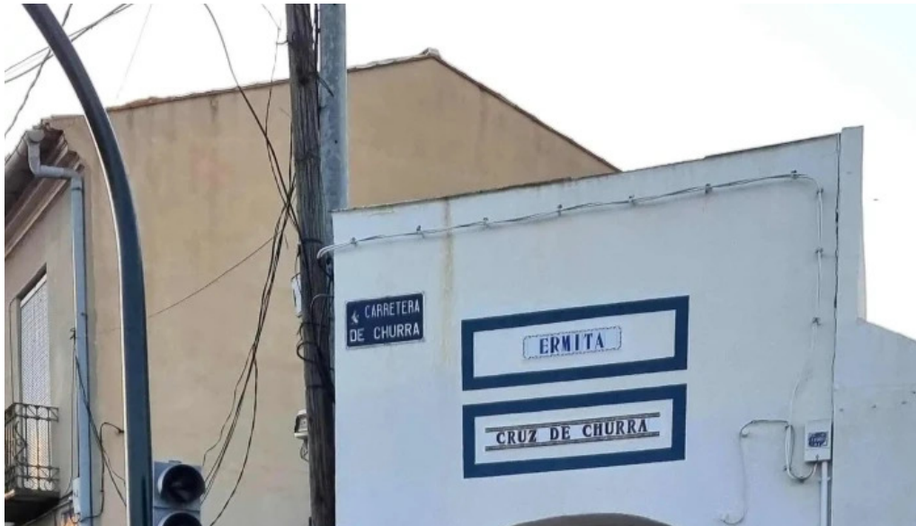
Ermita cruz de churra comentario 1