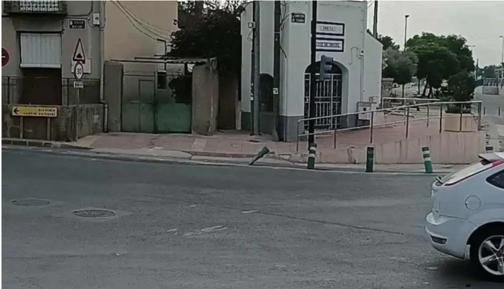
Ermita cruz de churra videos