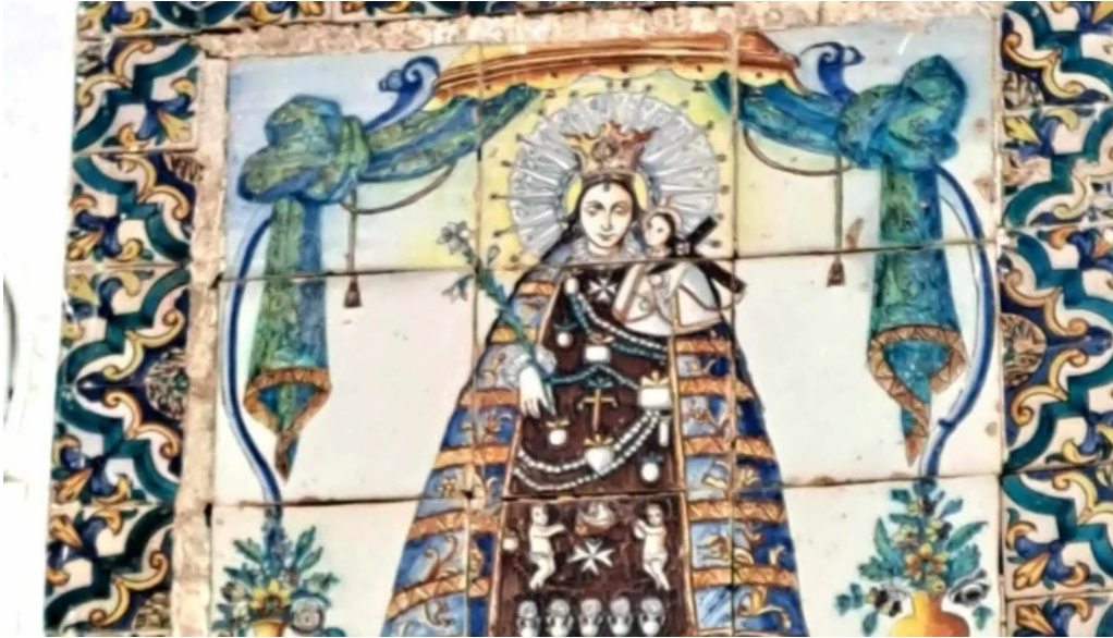
Ernita de la virgen de los desamparados como llegar