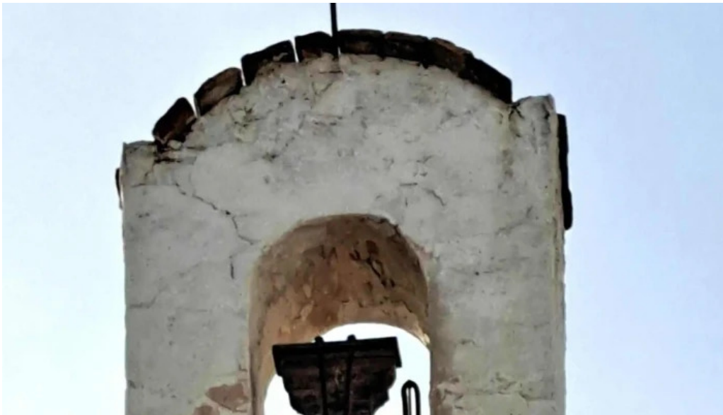
Ernita de la virgen de los desamparados comentarios