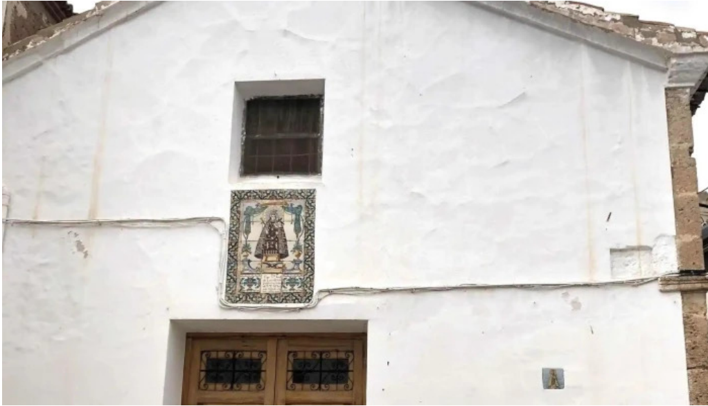
Ermita de la virgen de los desamparados instagram