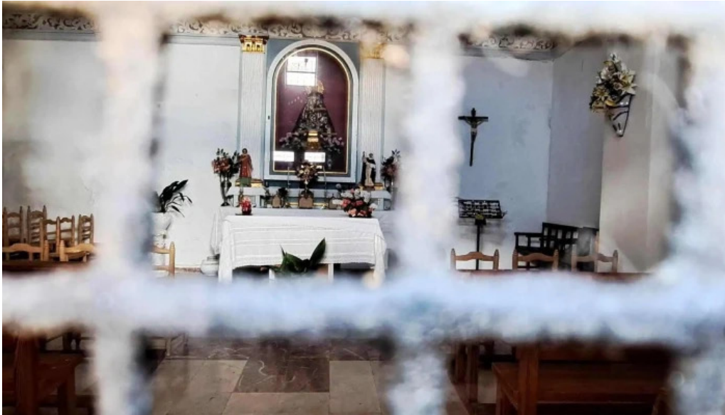
Ermita de la virgen de los desamparados puntaje