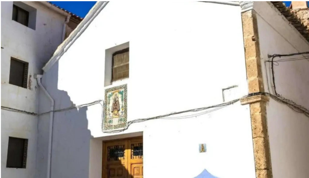
Ermita de la virgen de los desamparados iglesia