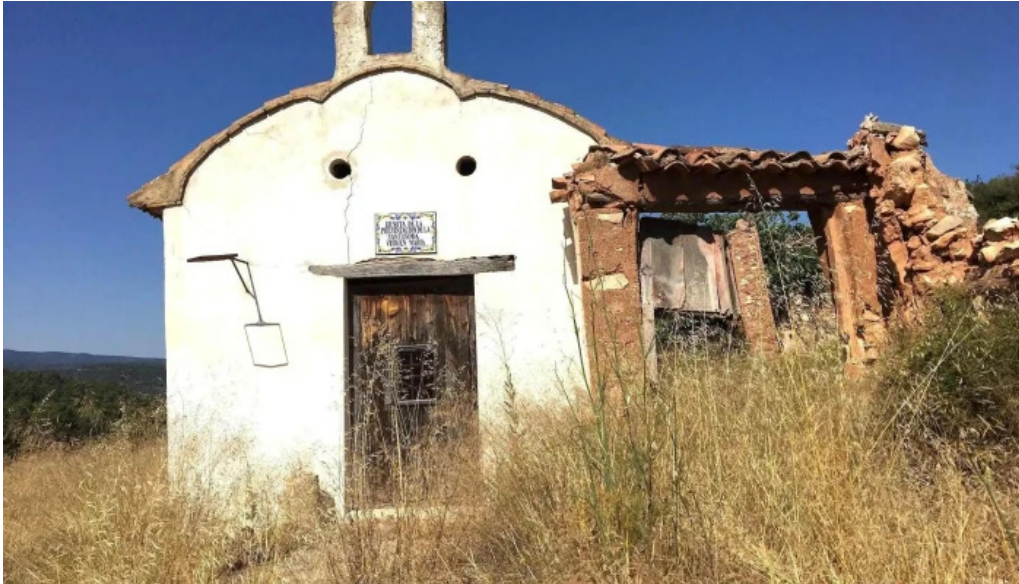
Ermita de la presentacion de la santisima virgen maria iglesia