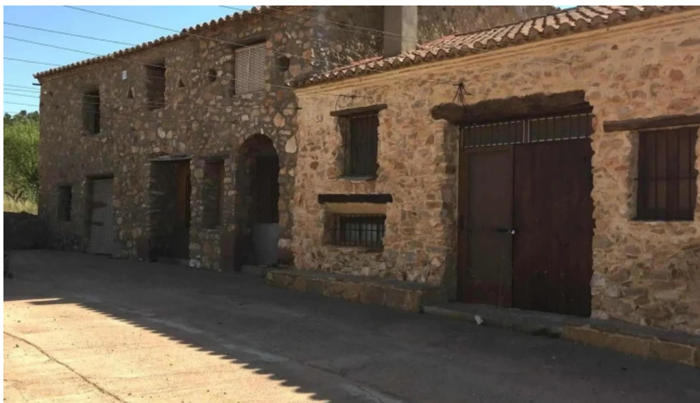
Ermita de la presentacion de la santisima virgen maria catalogo