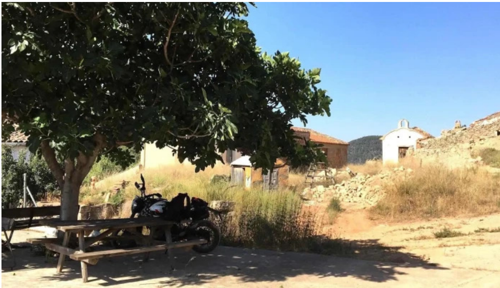
Ermita de la presentacion de la santisima virgen maria donde