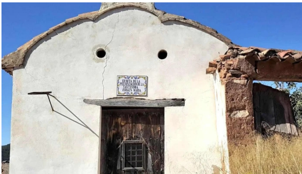
Ermita de la presentacion de la santisima virgen maria chelva