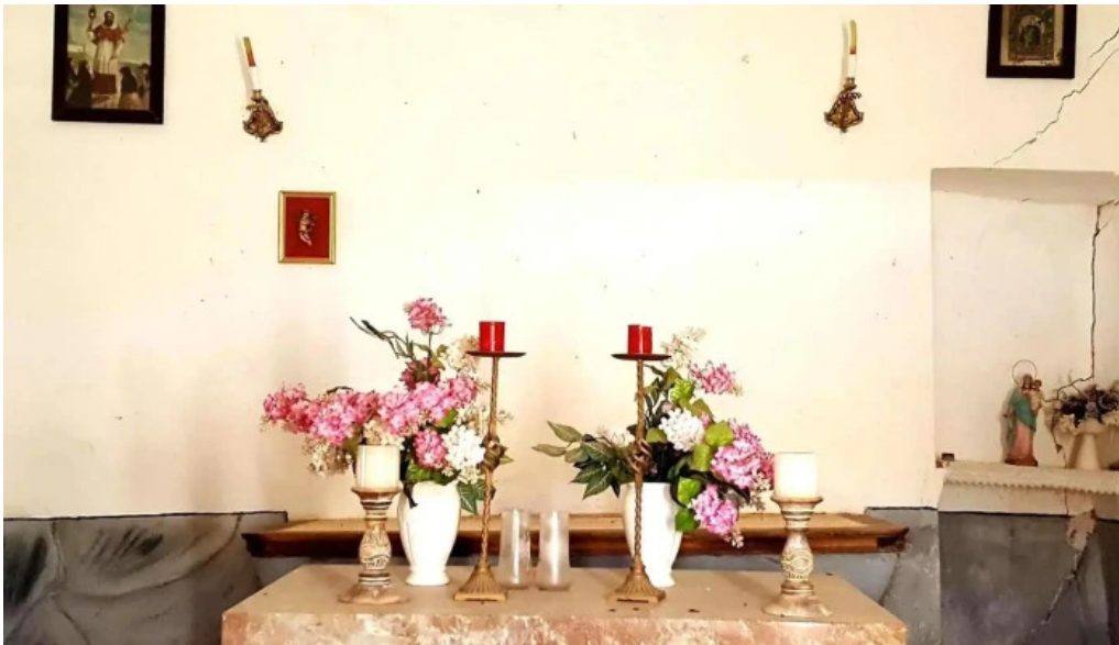
Ermita de la presentacion de la santisima virgen maria precios