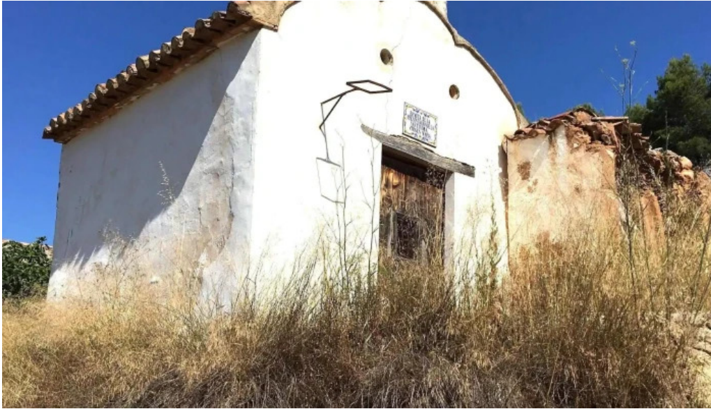
Ermita de la presentacion de la santisima virgen maria ubicacion