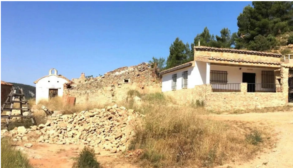
Ermita de la presentacion de la santisima virgen maria puntaje