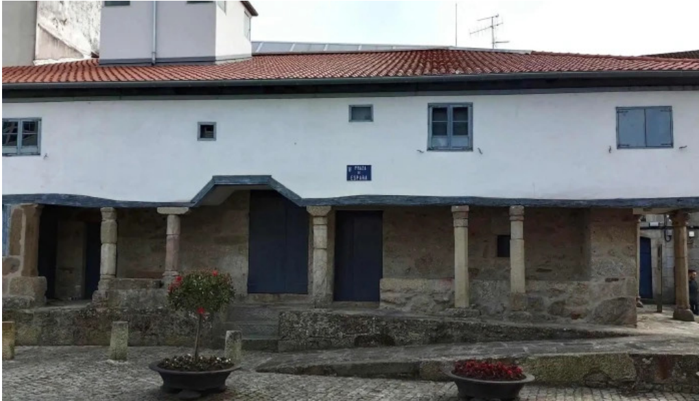
Iglesia de santa marina de chantada direccion