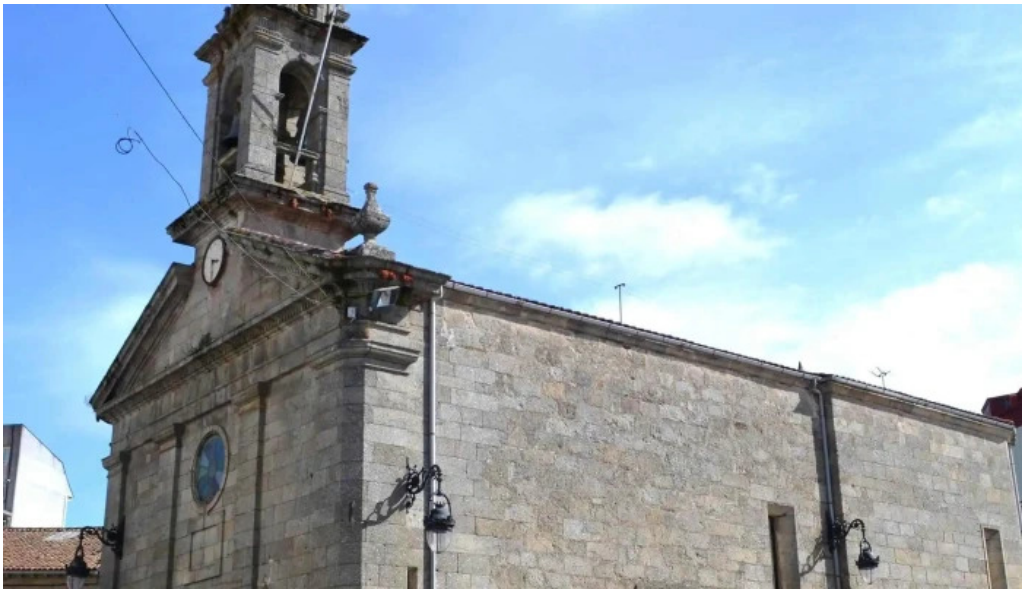
Iglesia de santa marina de chantada horario