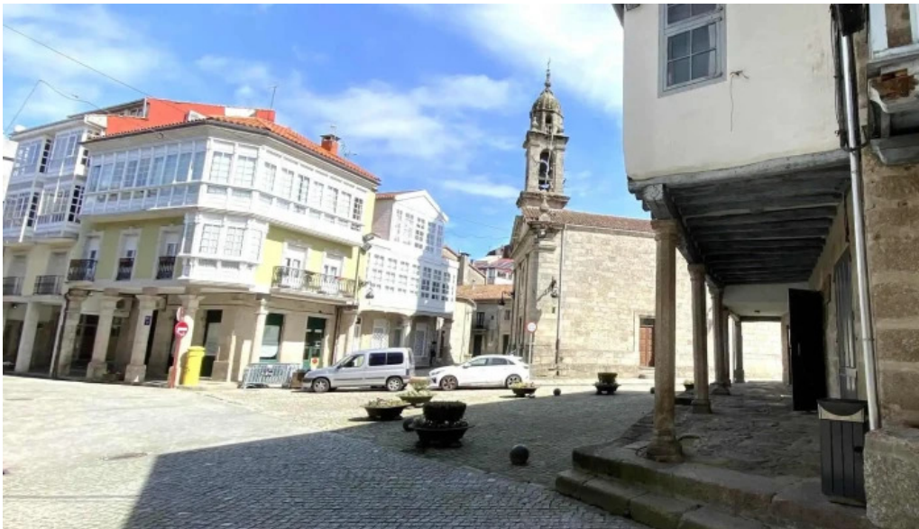
Iglesia de santa marina de chantada como llegar