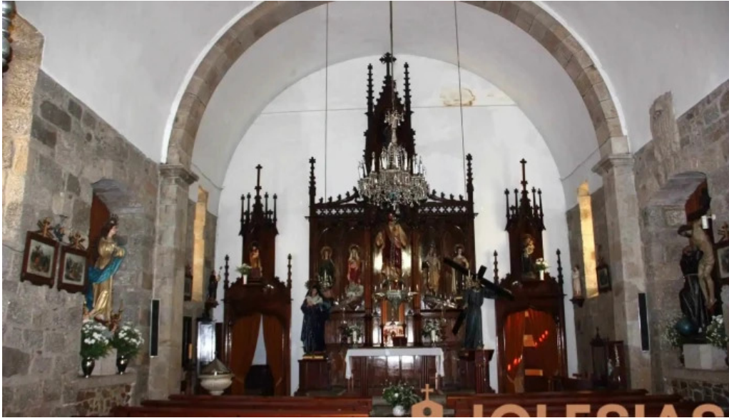
Iglesia de santa marina de chantada iglesia