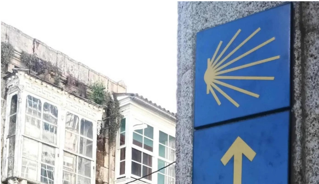
Iglesia de santa marina de chantada sitio web