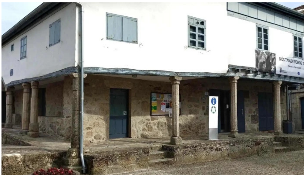
Iglesia de santa marina de chantada catalogo