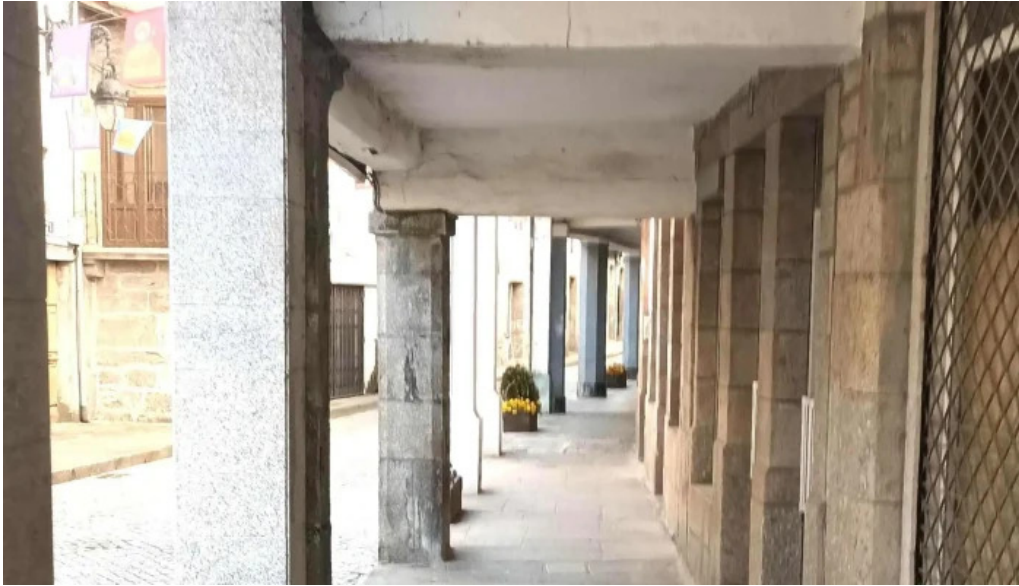
Iglesia de santa marina de chantada ubicacion