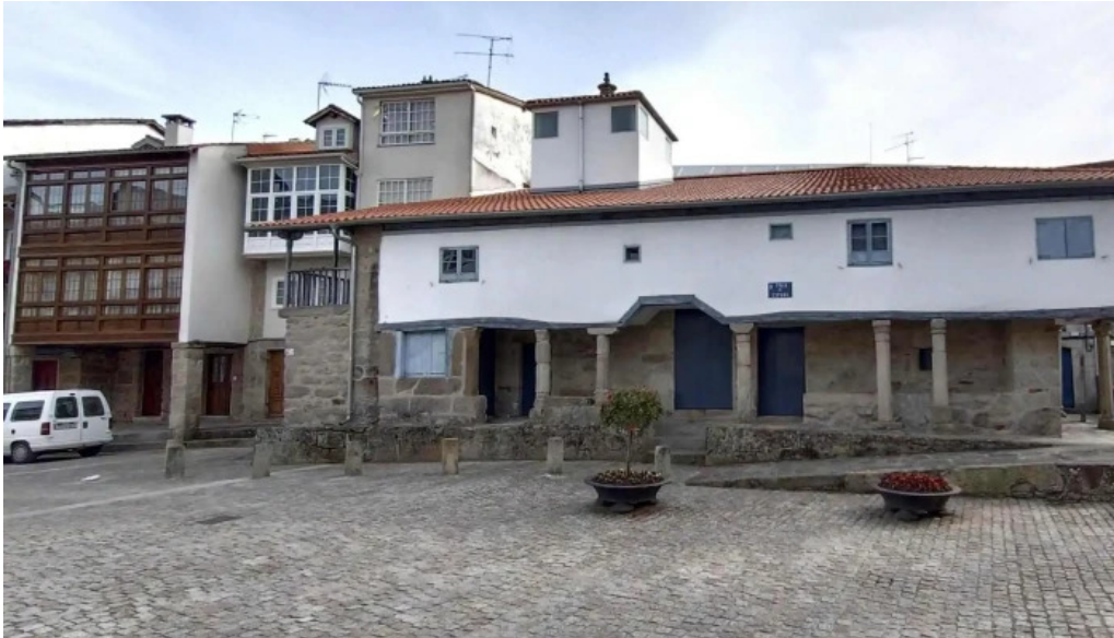
Iglesia de santa marina de chantada zona