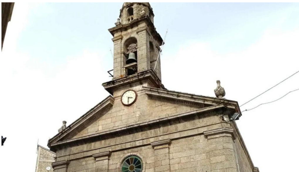
Iglesia de santa marina de chantada chantada