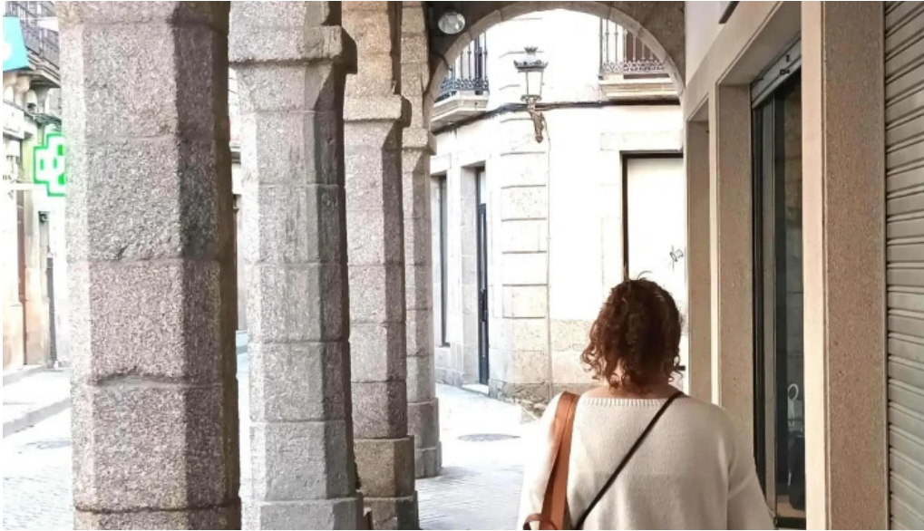
Iglesia de santa marina de chantada promocion