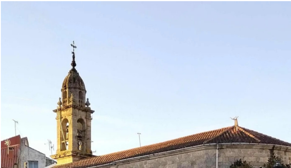
Iglesia de santa marina de chantada precios