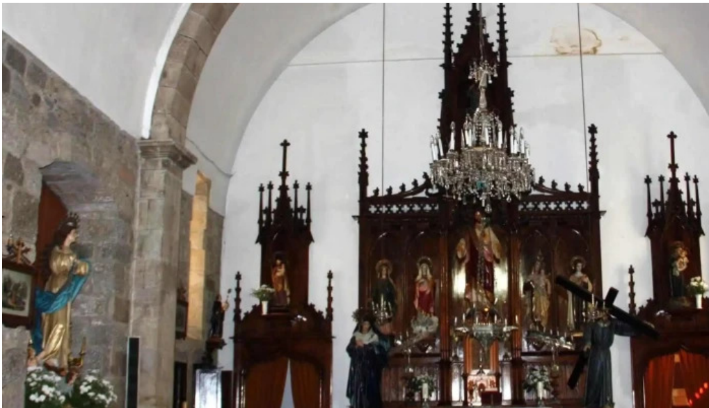
Iglesia de santa marina de chantada opiniones