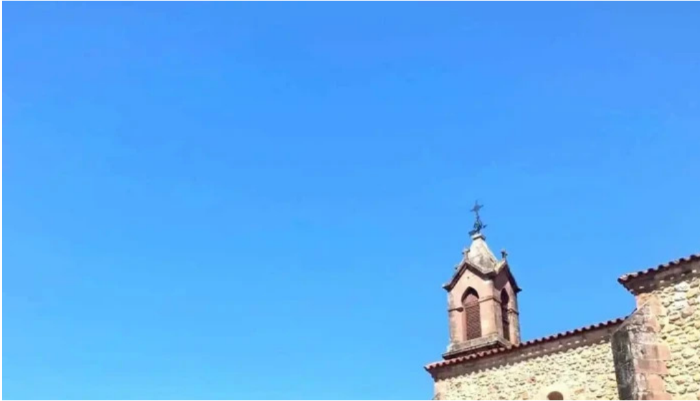
Iglesia de san roque iglesia