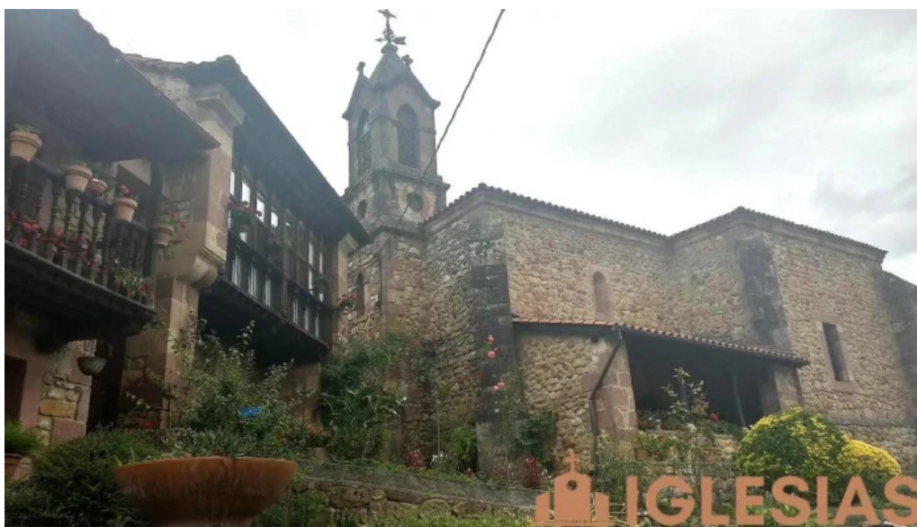
Iglesia de san roque celis