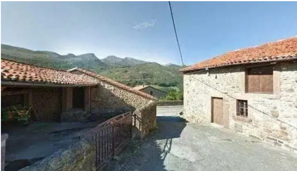
Iglesia de san roque como llegar