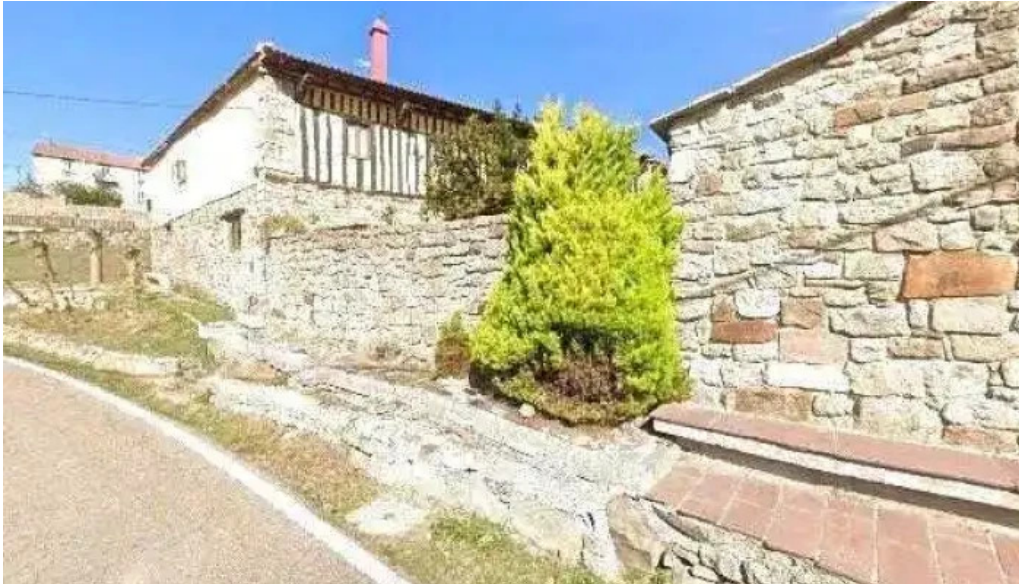
Iglesia santiago iglesia