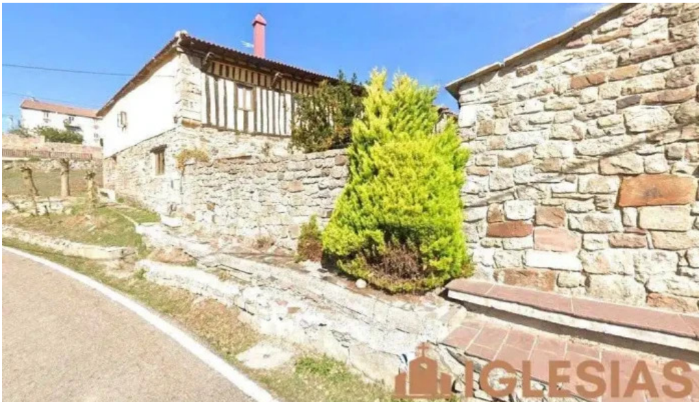
Iglesia santiago celada marlantes