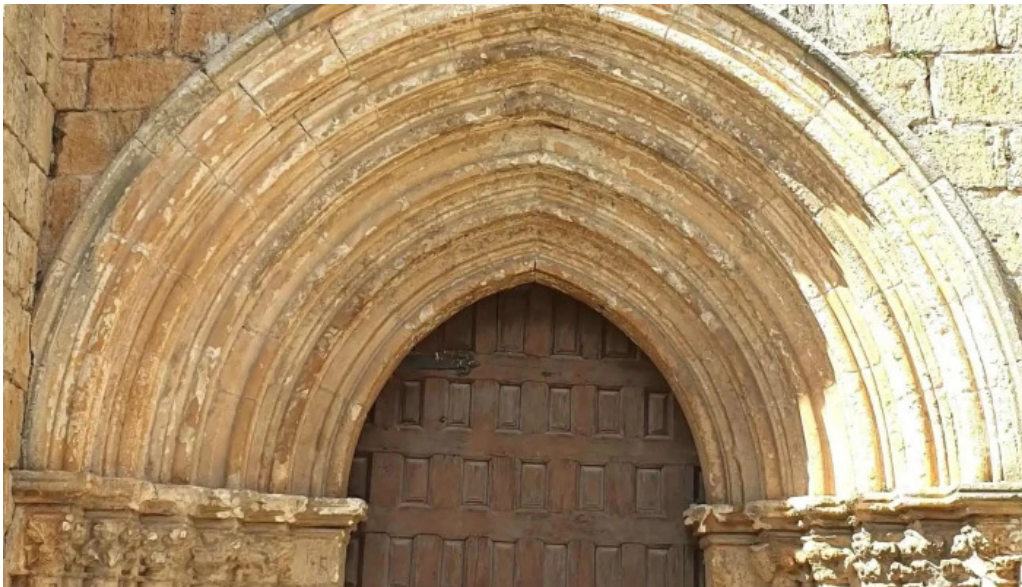
Iglesia de san miguel arcangel comentario 2