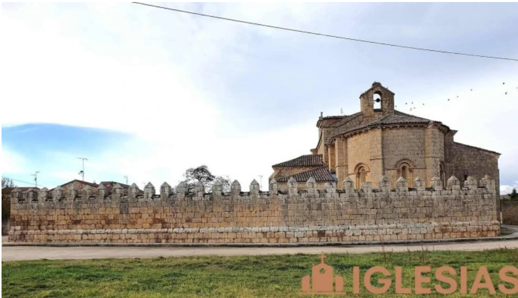
Iglesia de san miguel arcangel iglesia