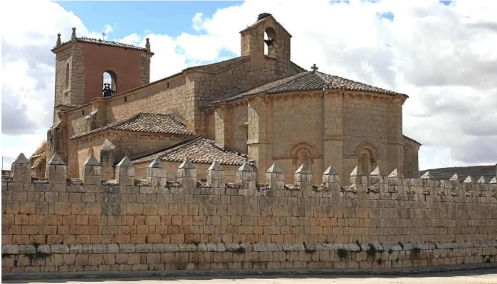
Iglesia de san miguel arcangel comentario 1