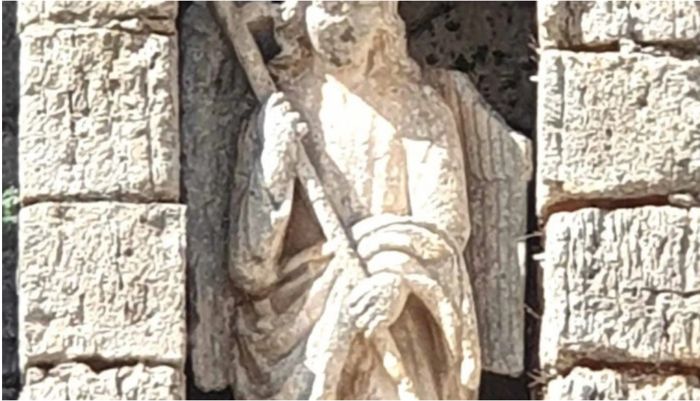
Iglesia de san miguel arcangel comentario 3