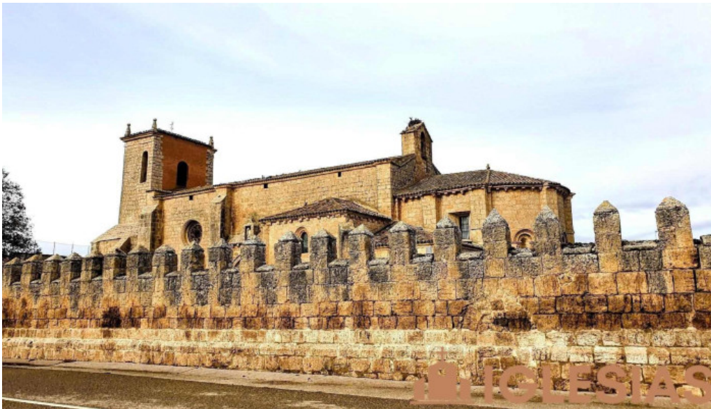
Iglesia de san miguel arcangel celada del camino