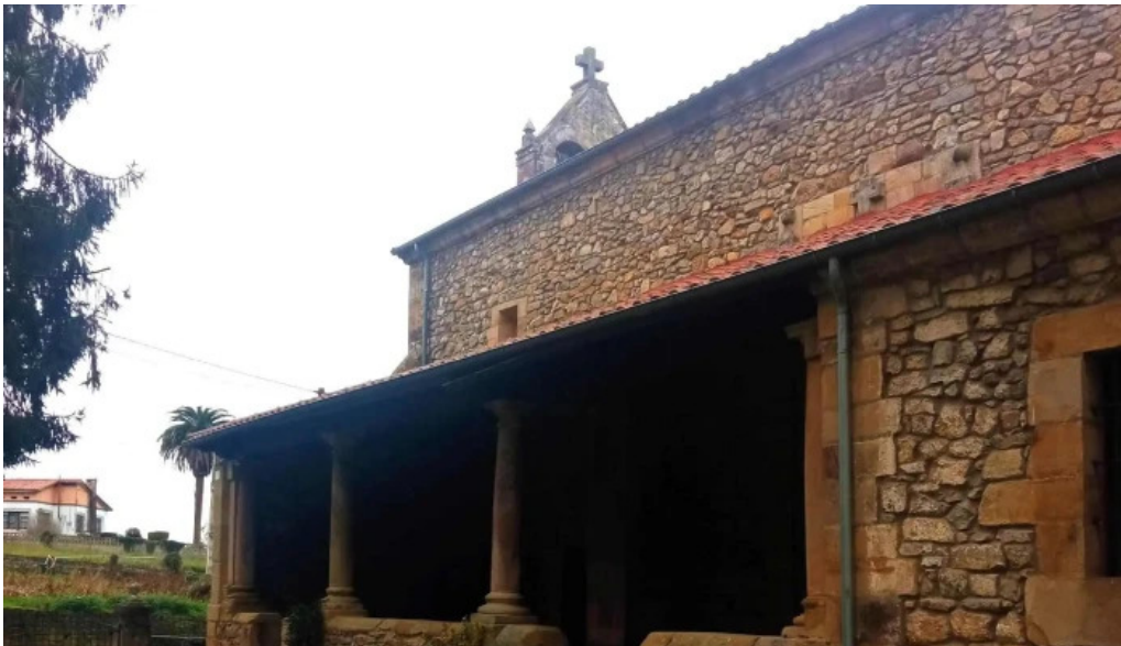
Parroquia de san justo y san pastor direccion