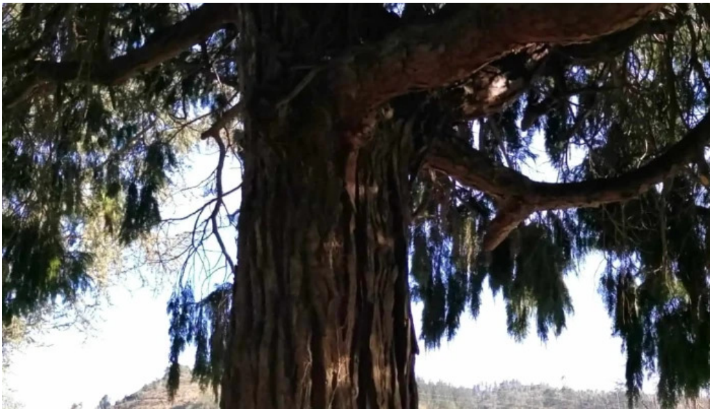
Parroquia de san justo y san pastor fotos