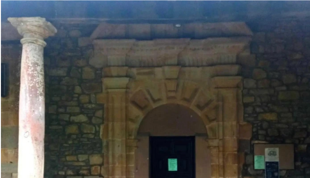
Parroquia de san justo y san pastor donde