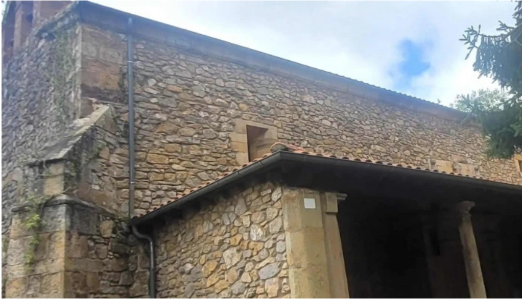
Parroquia de san justo y san pastor instagram