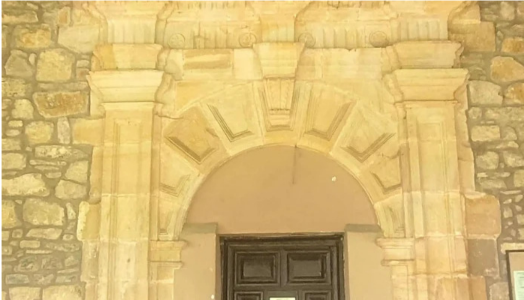
Parroquia de san justo y san pastor abierto ahora