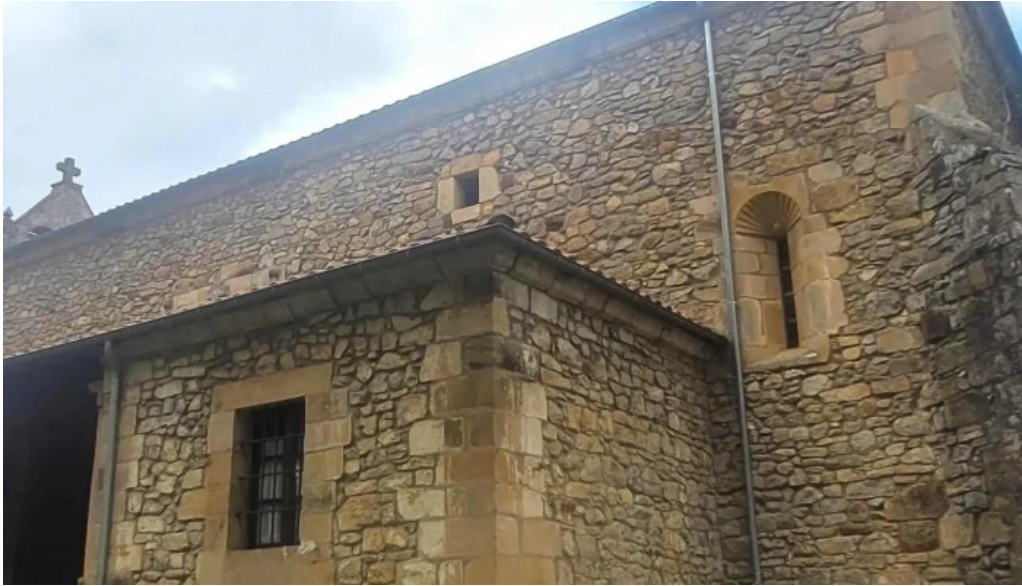
Parroquia de san justo y san pastor cerca de mi