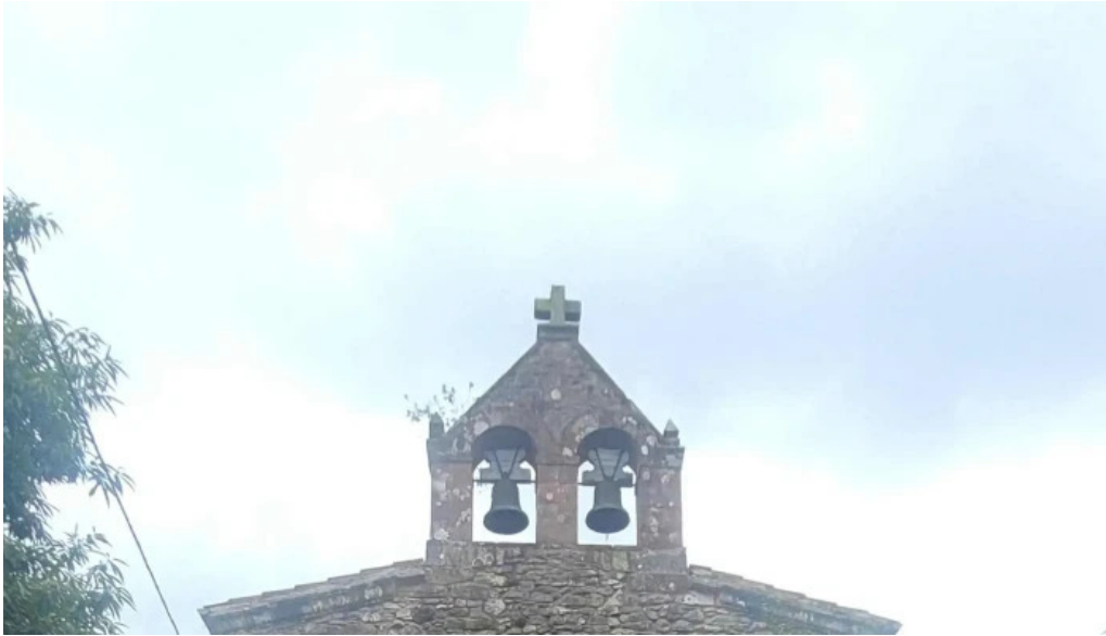
Parroquia de san justo y san pastor promocion