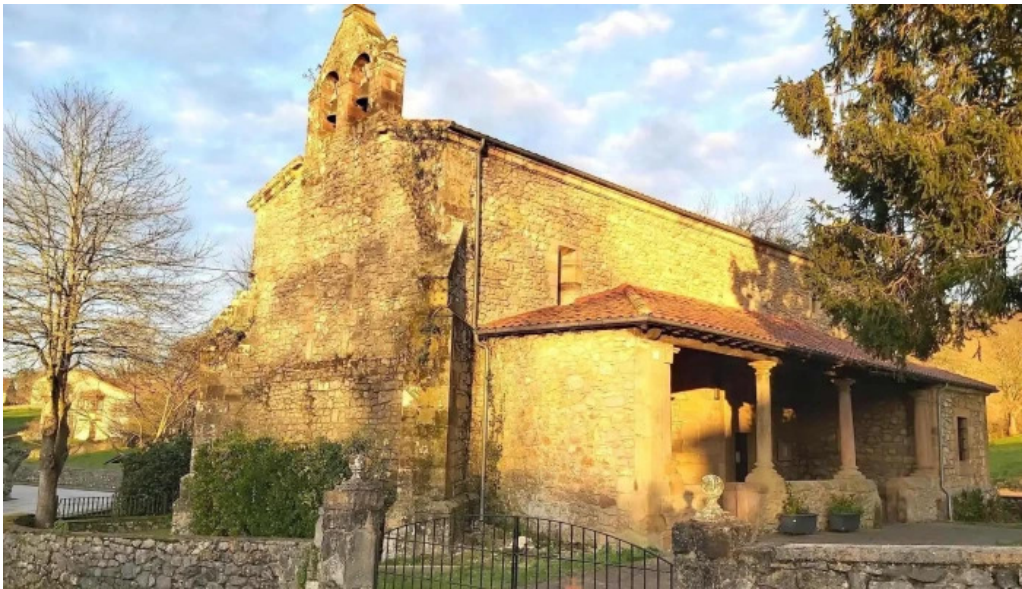
Parroquia de san justo y san pastor iglesia