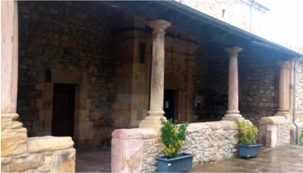
Parroquia de san justo y san pastor horario