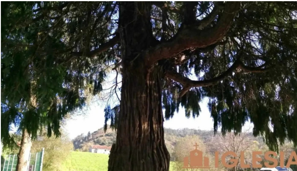
Parroquia de san justo y san pastor recientes