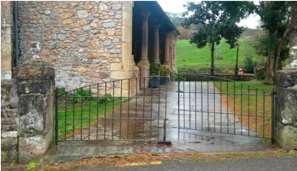
Parroquia de san justo y san pastor zona