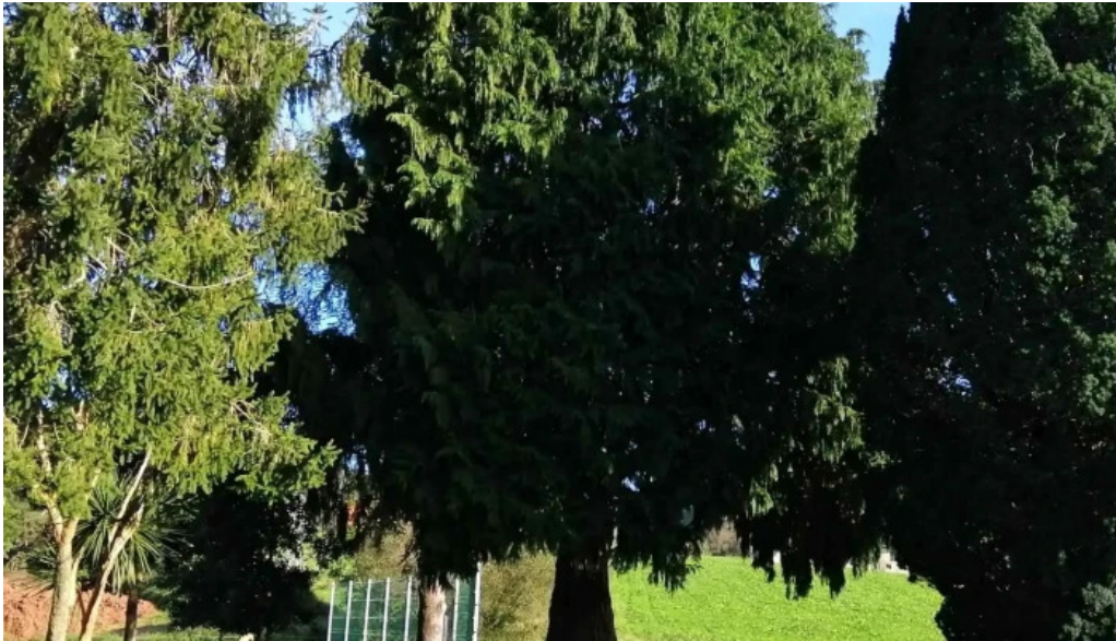
Parroquia de san justo y san pastor caviedes