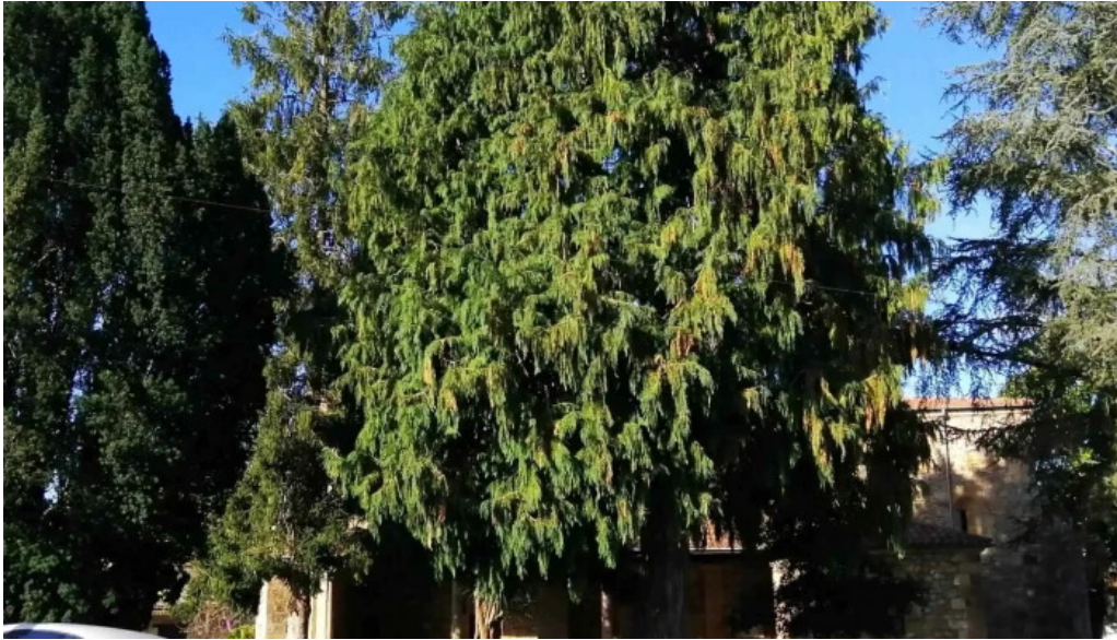
Parroquia de san justo y san pastor videos