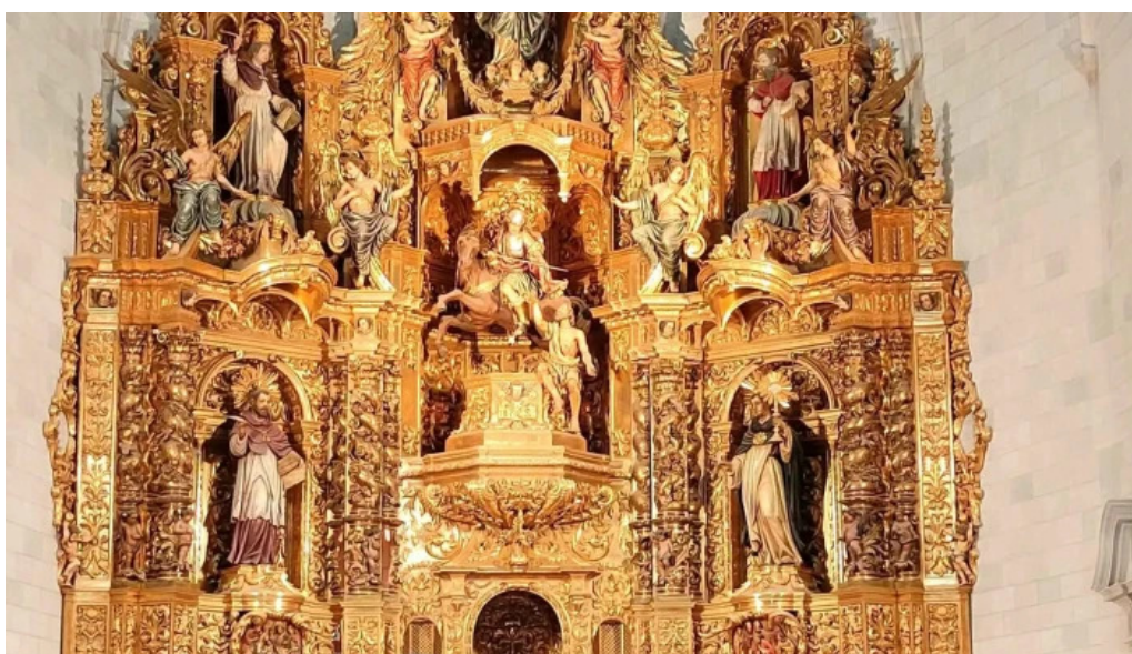
Iglesia de sant marti cassa de la selva