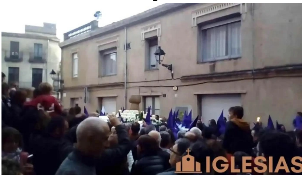
Iglesia de sant marti videos