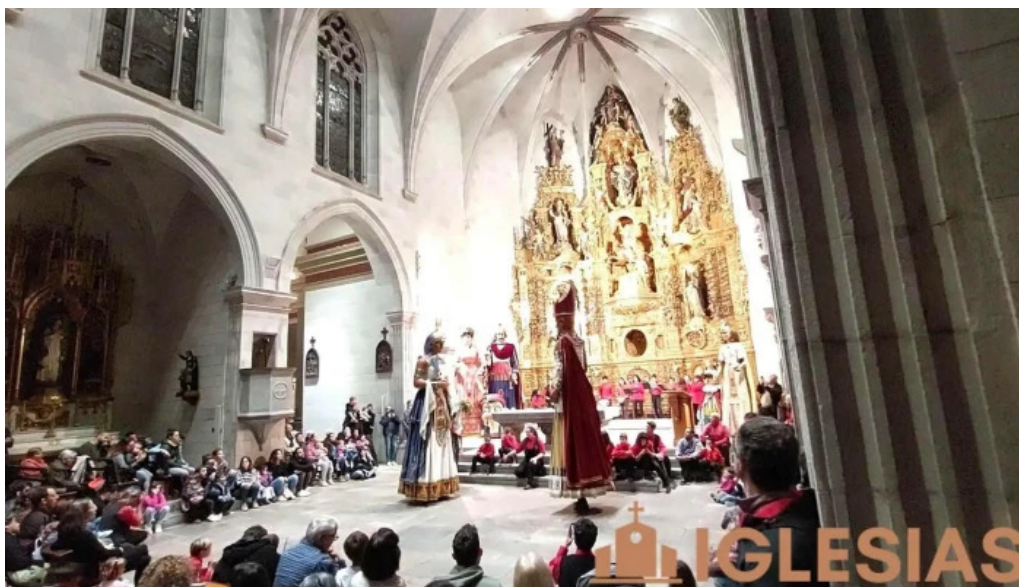
Iglesia de sant marti iglesia