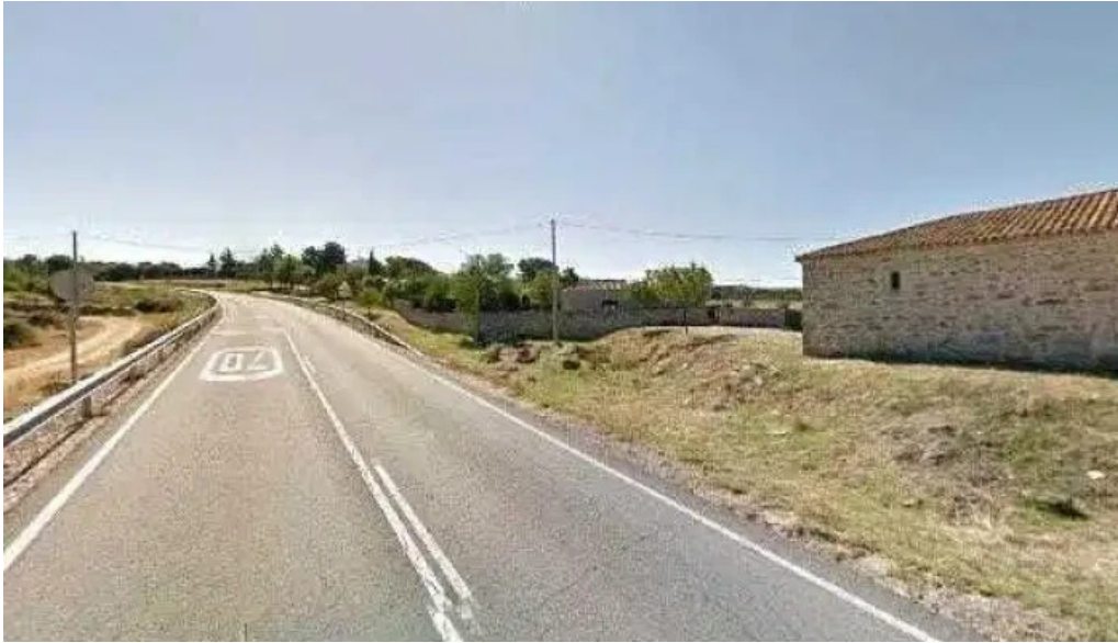
Ermita de nuestra senora de las fuentes precios