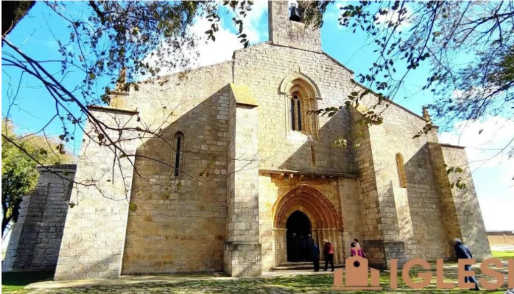
Ermita de nuestra senora de las fuentes iglesia