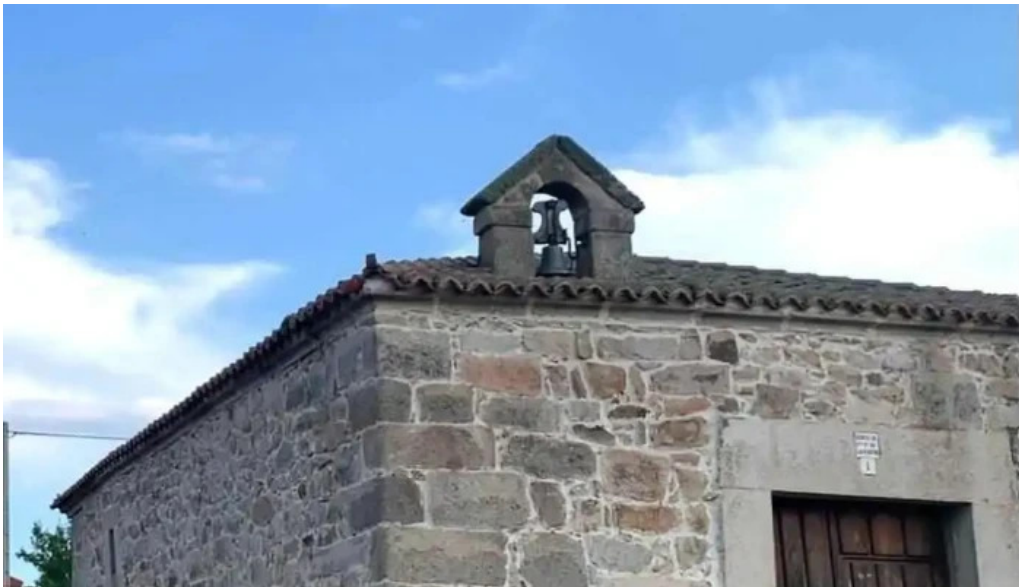
Ermita de nuestra senora de las fuentes cardenosa