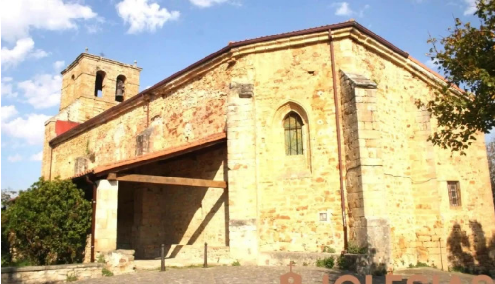
Iglesia de san sebastian iglesia