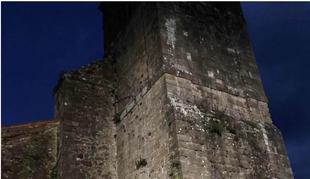
Iglesia de san sebastian cantabria