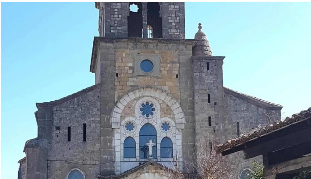
Iglesia de san ignacio ubicacion