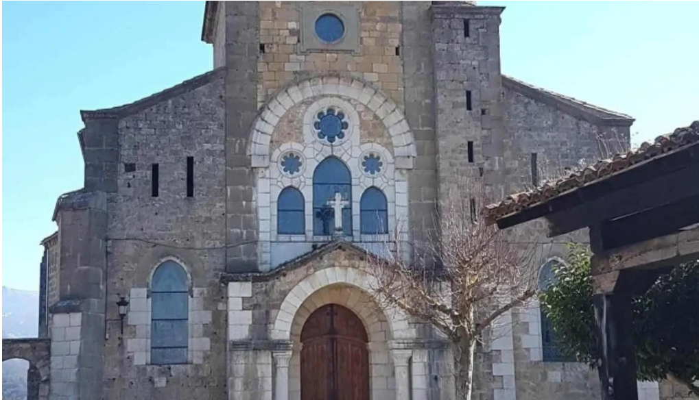
Iglesia de san ignacio iglesia