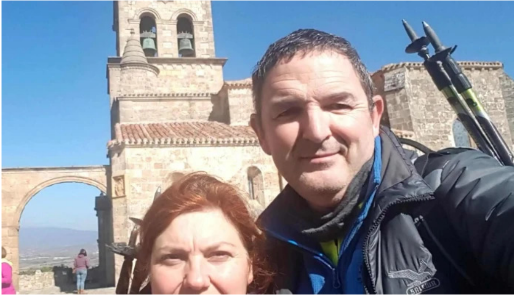
Iglesia de san ignacio puntaje