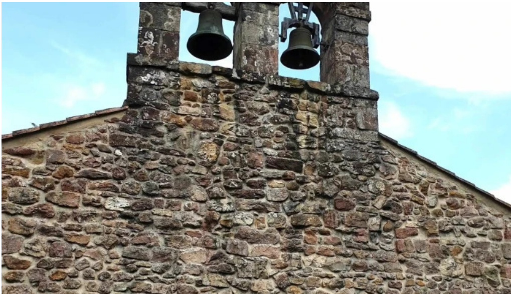
Iglesia de san ignacio cantabria