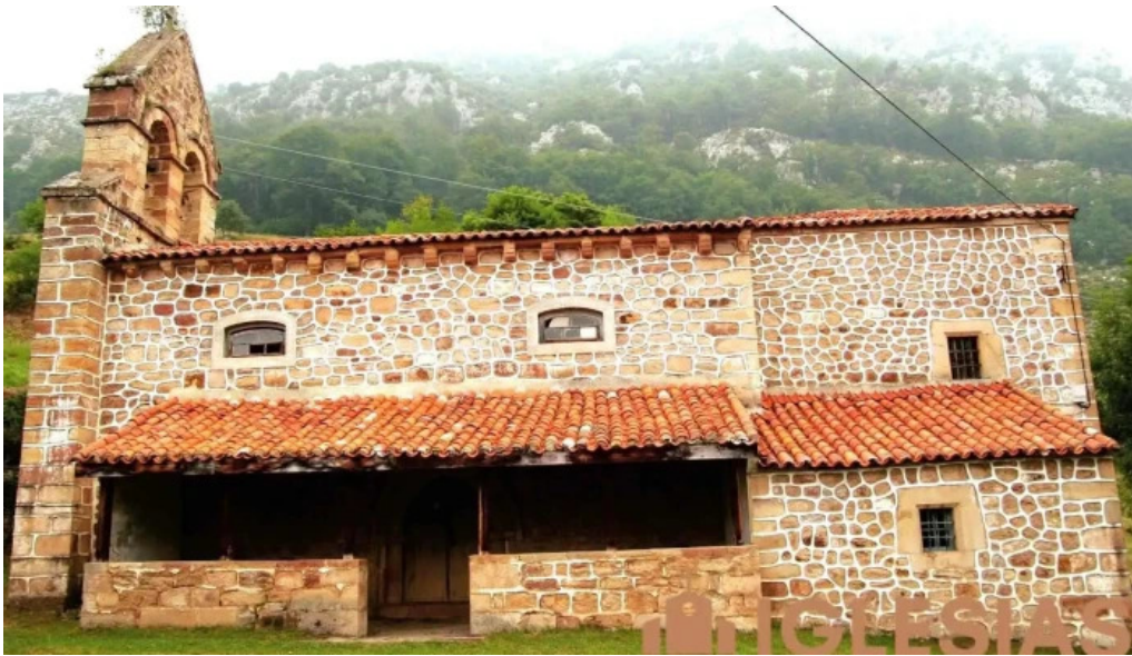
Iglesia de san andres cantabria