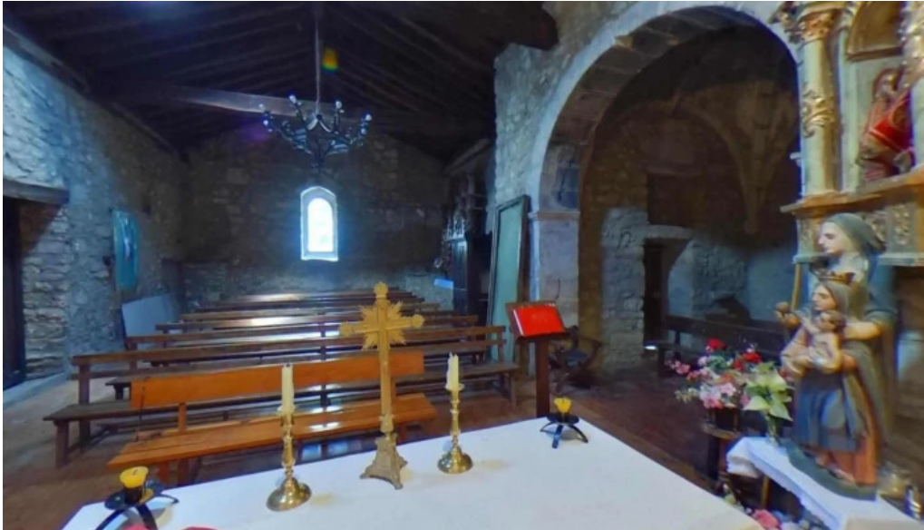
Iglesia de nuestra senora de la piedad comentarios