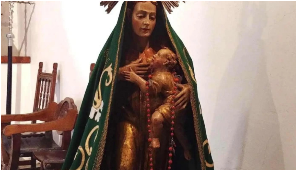
Iglesia de nuestra senora de la piedad iglesia