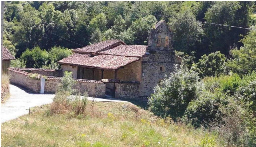
Iglesia de nuestra senora de la piedad cantabria