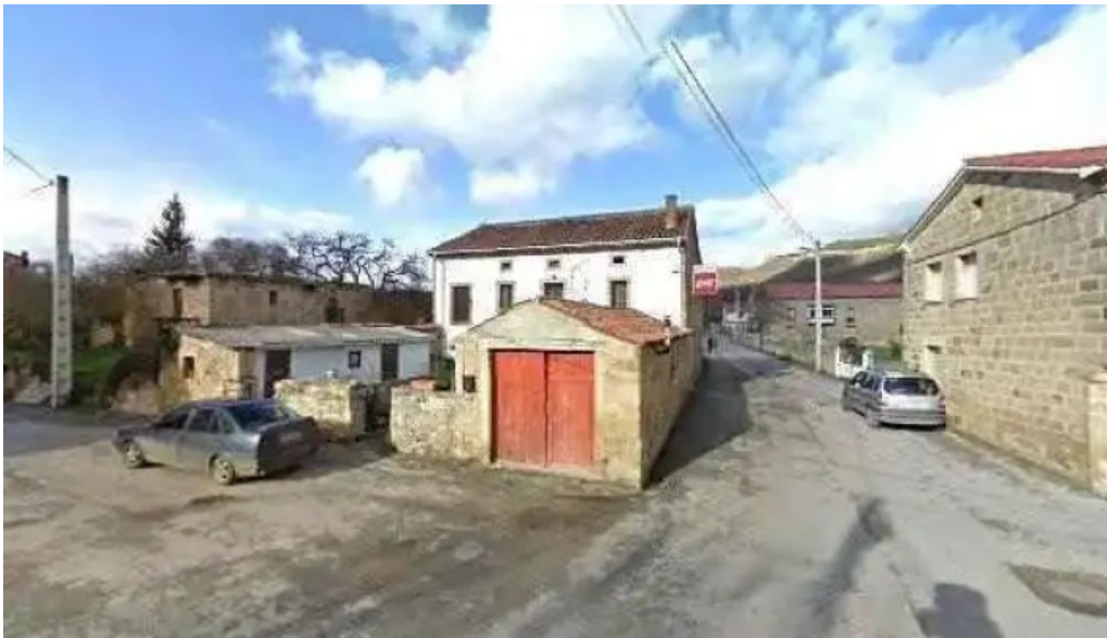
Iglesia de bo san martin de elines iglesia