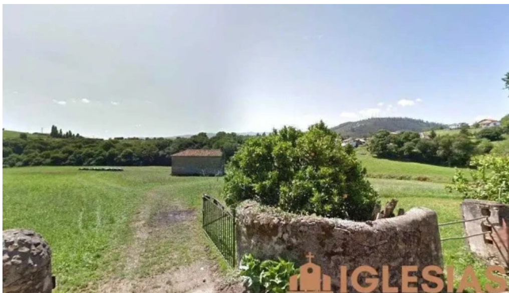
Ermita santa marina cantabria