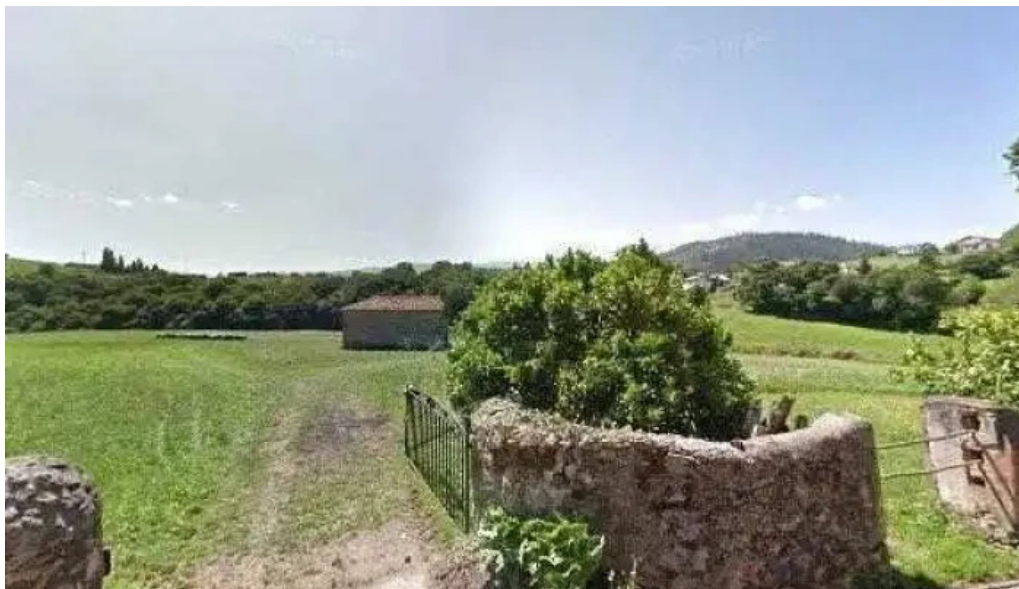
Ermita santa marina iglesia