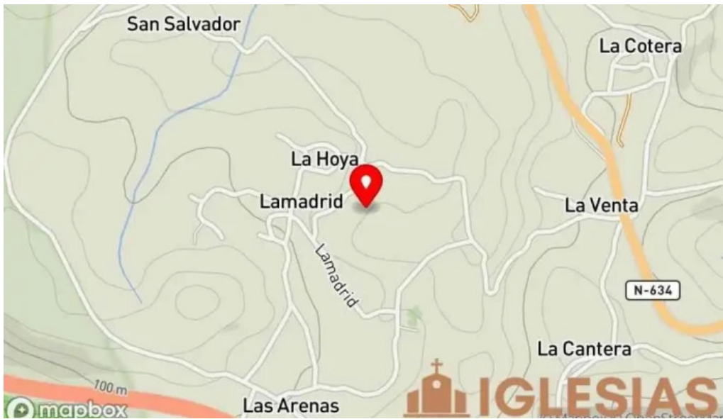
Ermita santa marina mapa