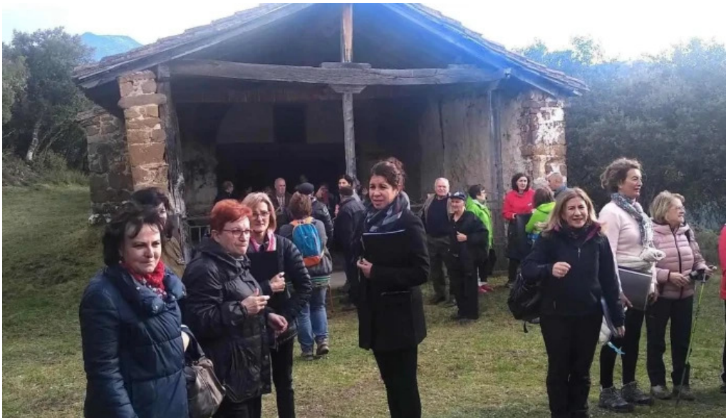
Ermita santa lucia armano liebana iglesia