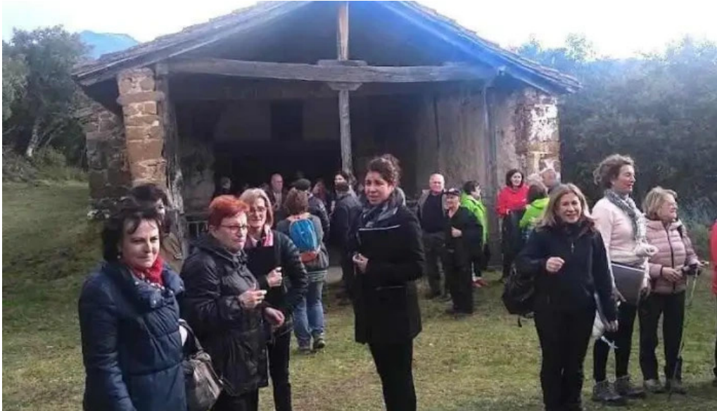
Ermita santa lucia armano liebana cantabria